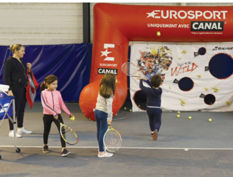
La précision est de mise : il faut viser les espaces dans ce jeu.

▲ Radar de vitesse, toboggan, mur interactif, sumos et autres animations autour du tennis : les Maisonnais disposaient de nombreuses possibilités de s'amuser le 6 octobre dernier. Pour sa 2 e édition de la fête de rentrée, le Passing Club de Maisons-Alfort accueillait petits et grands de 14 h à 17 h au parc Jean de la Fontaine, sur les bords de Marne. Rires et bonne humeur étaient au programme, en plus des 4 places à gagner pour le tournoi de tennis Paris-Bercy.