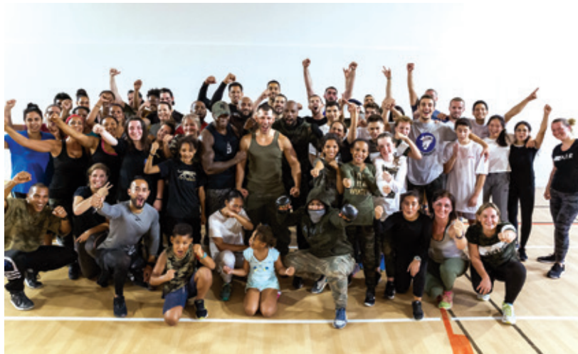
Les participants au Boot camp, fiers de leur exploit sportif.

Le 22 septembre s'est déroulé au gymnase Pompidou le premier Boot camp – un type d'entraînement militaire en groupe – organisé par les membres de l'Athlétic Club de Maisons-Alfort, et des encadrants bénévoles. Ici pas d'instructeurs ni d'armée, l'ambiance étant conviviale, l'objectif étant de se dépenser sur plusieurs ateliers pensés également pour les enfants (âgés d'au moins 10 ans). Au programme de cette matinée sportive, plusieurs parcours étaient ainsi proposés : circuit training axé sur les principes de la boxe, parcours extérieur, musculation et cardio, course, exercices de poids de corps, squats ou encore gainages. Une première couronnée de succès puisque l'animation a réuni 51 participants. Le prochain Boot camp sera proposé dans le cadre du Téléthon, le dimanche 8 décembre (voir P. 8 de ce numéro).