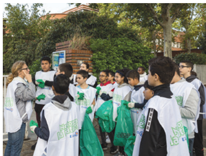
Après un cours sur l'histoire du quartier Liberté Vert-de-Maisons, place au ramassage des déchets pour ces élèves du collège Jules Ferry.

fructueux : plus de 70 kg de déchets ont été collectés par les trois classes lors de cette journée dédiée à la nature et à sa préservation. Et ce, sous le regard des habitants du quartier qui n'ont pas été avares en félicitations.