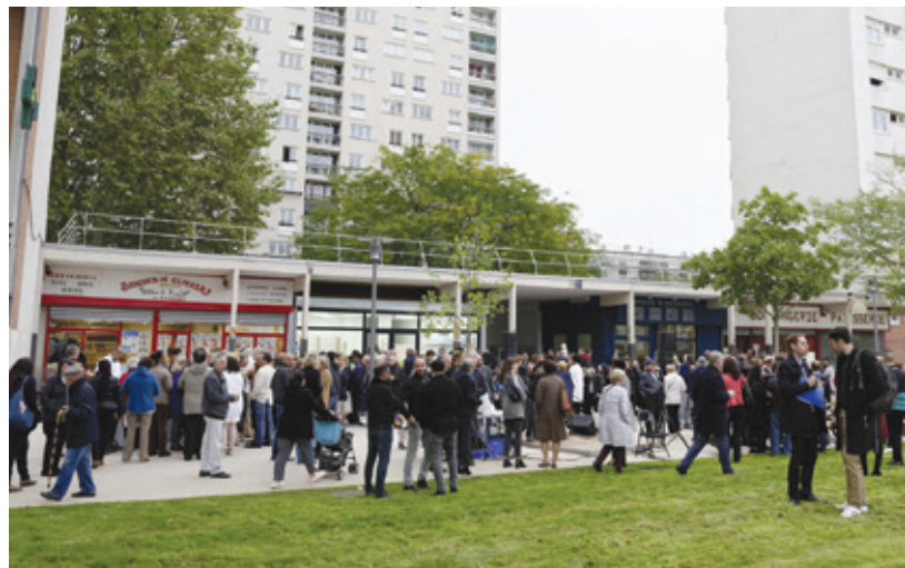
Les habitants du quartier Liberté Vert-de-Maisons sont venus nombreux pour partager ce moment convivial.