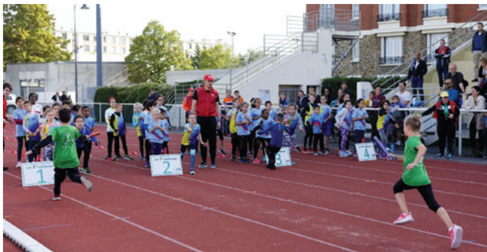
Parmi les épreuves des Poussinades, la course de relais.

L'ASA Athlétisme de Maisons-Alfort a organisé, avec la Ligue de France d'Athlétisme, les Poussinades 2019 au Stade Delaune le dimanche 13 octobre. De 8 h à 18 h, près de 600 enfants s'y sont dépensés et amusés en pratiquant de multiples ateliers par équipe : perche, lancer de marteau, endurance, sprint, saut de haies... Ce grand rassemblement des écoles d'athlétisme d'Île-de-France s'est déroulé dans la bonne humeur et sous un beau soleil.