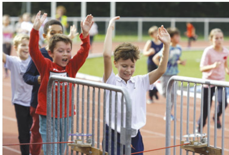
Les élèves passent le compteur de kilomètres parcourus.

Cette année, l'USEP (Union sportive de l'enseignement du premier degré) 94 a organisé dans de nombreuses communes du Val-de-Marne la course « 1,2,3 Courez, Volez ! » au profit de l'association ELA, dont Maisons-Alfort. Les écoles maisonnaises ont répondu à l'appel : au total, 1 858 élèves répartis dans 78 classes des écoles élémentaires de la ville ont relevé ce beau challenge. Tous les niveaux ont participé, du CP au CM2, les « grands » étant encouragés à parrainer les « petits » et à les aider dans leur course. Un bel exemple de solidarité.