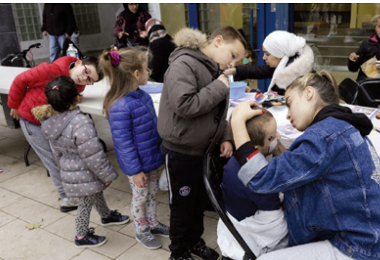
Le stand maquillage proposé par le CSC Liberté a rencontré beaucoup de succès auprès des plus jeunes.

Un travail spécifique a également été réalisé sur l'éclairage, désormais moins énergivore. L'organisation du stationnement a entièrement été revue et se fait en épis le long de l'avenue de la Liberté, tout en conservant le même nombre de places qu'avant (133). Cette transformation s'est accompagnée d'une mise en sens unique d'une partie de l'avenue dans le sens Créteil vers Maisons-Alfort, entre l'accès rue de Liège et le nouveau giratoire installé.