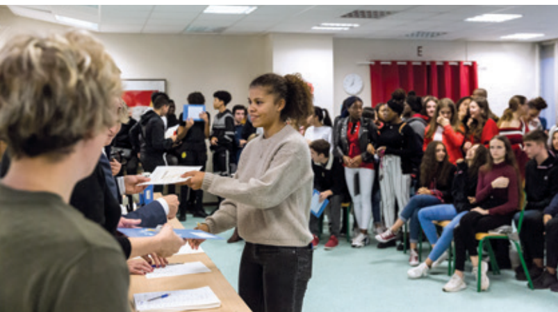
Les élèves du collège Nicolas de Staël reçoivent leurs diplômes.

Si la rentrée scolaire est synonyme de reprise des cours, elle est également associée depuis quelques années à la remise officielle du diplôme du brevet des collèges. Le 17 octobre, c'était au tour des élèves des collèges Condorcet et Nicolas de Staël de recevoir leur précieux sésame en présence des équipes pédagogiques, du maire de Maisons-Alfort et conseiller départemental, accompagné des 1 er et 3 e maires-adjoints respectivement conseillères départementale et régionale.