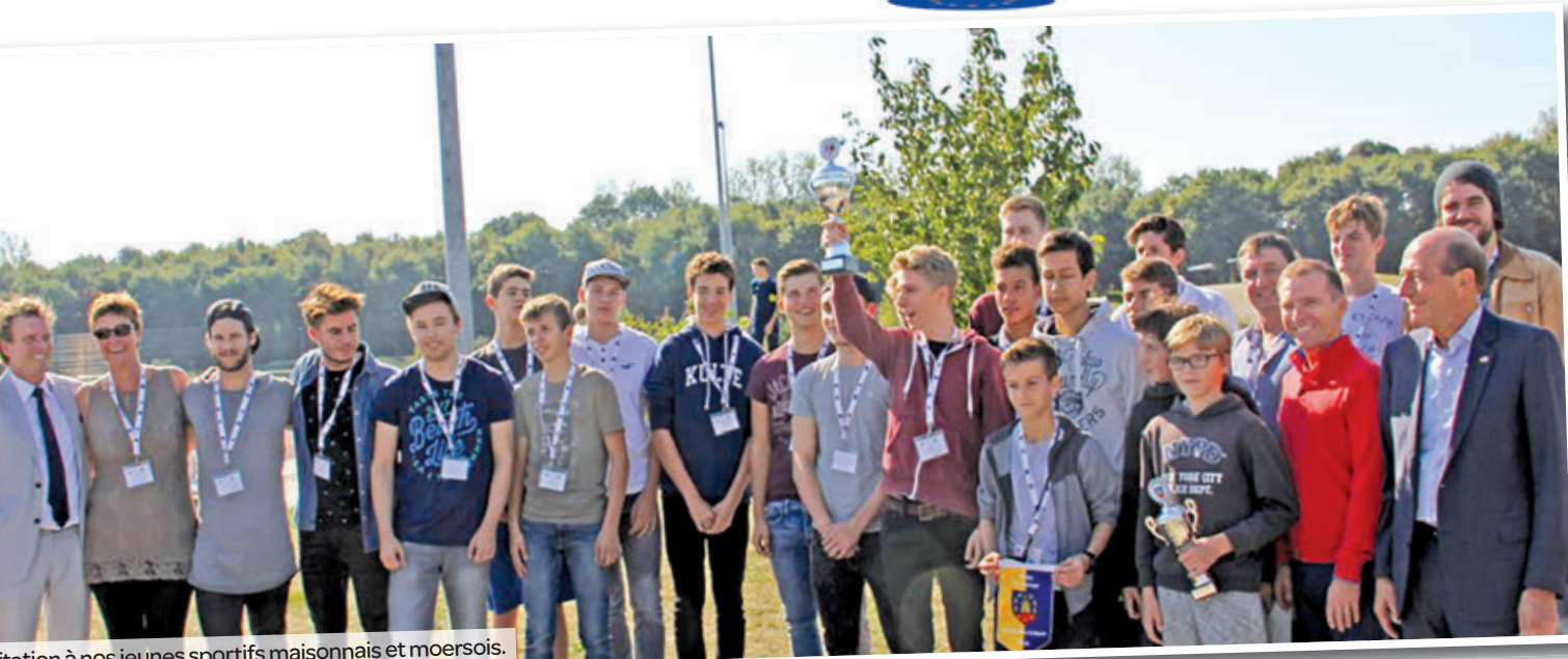
Invitation à nos jeunes sportifs maisonnaïses et moersois.