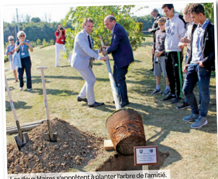
Les deux Maires s'appêtent à planter l'arbre de l'amitié.