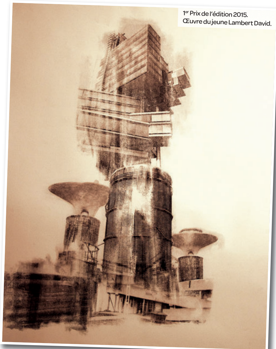
1 er Prix de l'édition 2015. Œuvre du jeune Lambert David.

> Pour connaître toutes les modalités, merci de vous adresser au Bureau Information Jeunesse : 6 bis avenue de la République 01 49 77 80 38 Info.j@bij-maisons-alfort.com