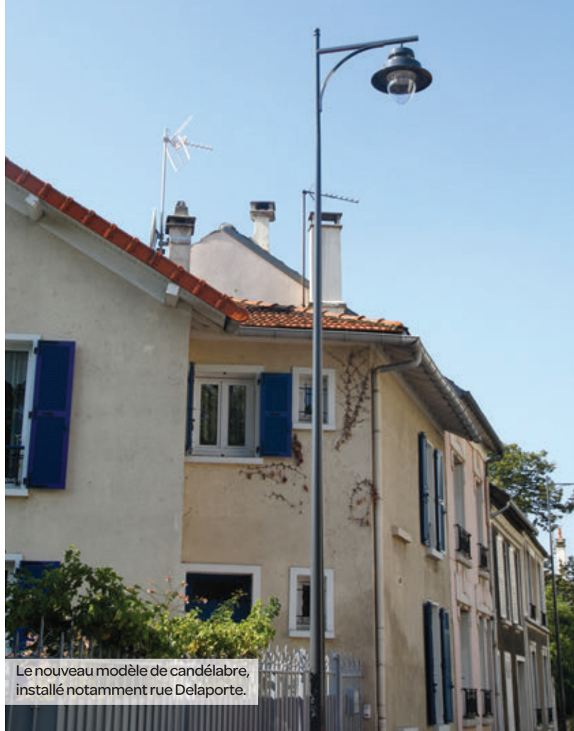
Le nouveau modèle de candélabre, installé notamment rue Delaporte.

90 % du programme du remplacement des 2 600 candélabres de notre ville a été réalisé et s'achèvera en 2017.