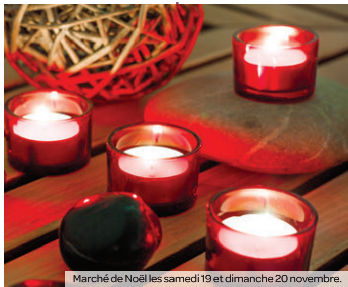
Marché de Noël les samedi 19 et dimanche 20 novembre.

Dimanche 13 CSC La Croix des Duches 9 h-12 h 30 Rencontres philatéliques Organisées par l'APMASM.