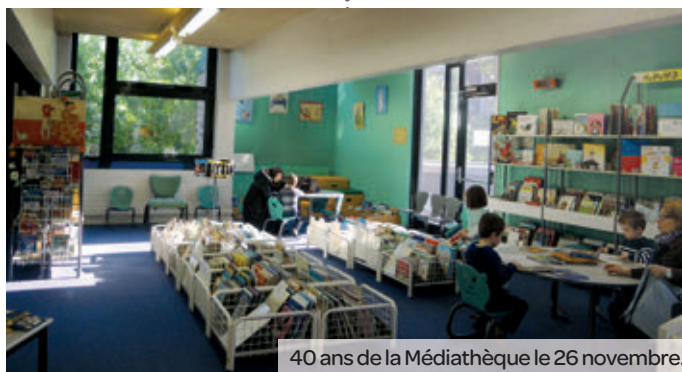
40 ans de la Médiathèque le 26 novembre.

CSC Les Planètes 14 h-20 h Diner dansant Organisé par la Joie de Vivre.