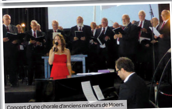
Concert d'une chorale d'anciens mineurs de Moers.