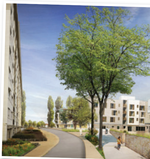
La rue de Marne, avec le futur foyer d'accueil médicalisé et la pension de famille.

Trois autres grands projets prendront également place à la suite de la démolition de l'ancienne résidence Louis Fliche :