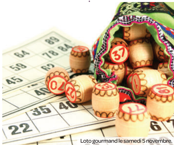
Loto gourmand le samedi 5 novembre.