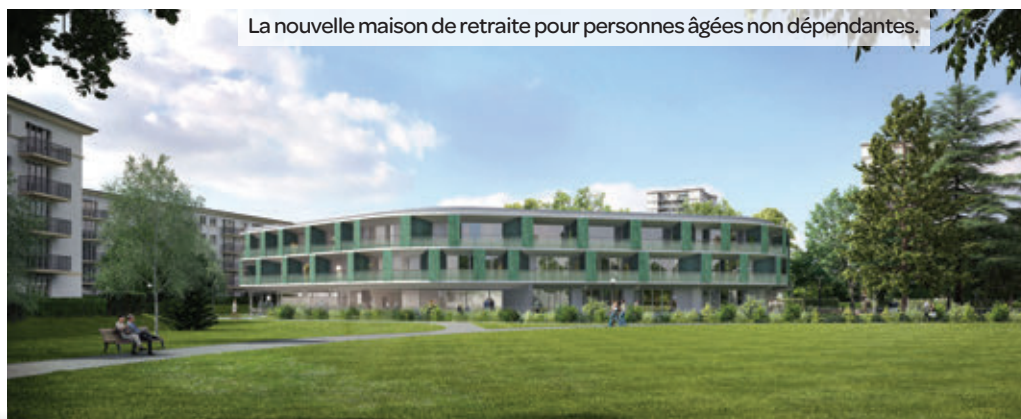
La nouvelle maison de retraite pour personnes âgées non dépendantes.