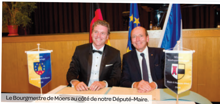
Le Bourgmestre de Moers au côté de notre Député-Maire.

Pour symboliser les liens forts de cette amitié déjà vieille d'un demi-siècle, les deux maires ont planté ensemble un chêne de Marais au sein des nouvelles installations du complexe sportif Grafschafter Spielverein.