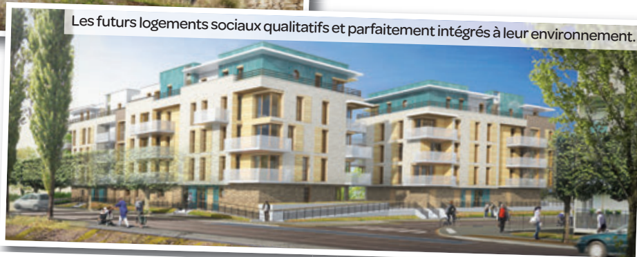
Les futurs logements sociaux qualitatifs et parfaitement intégrés à leur environnement.

En effet, à la place de la résidence vétuste, actuellement située rue du Soleil, sera construite une nouvelle maison de retraite pour les personnes âgées non dépendantes d'une capacité de 70 places dont 1/3 à destination des couples – une caractéristique particulièrement inédite, avec des logements de 46 m 2 . La résidence comprendra aussi plusieurs studios de 35 m 2 .