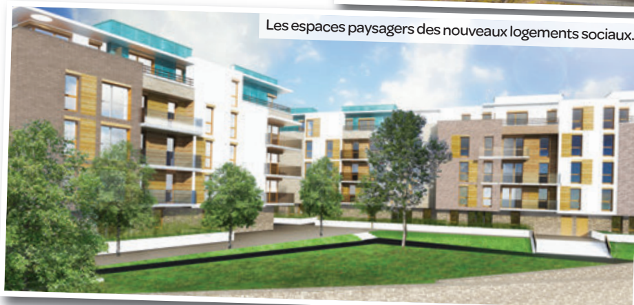
Les espaces paysagers des nouveaux logements sociaux.