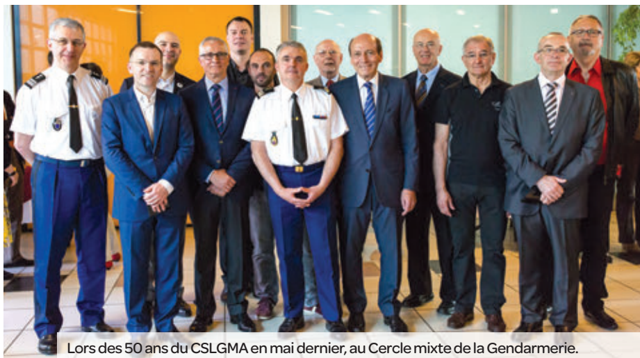
Lors des 50 ans du CSLGMA en mai dernier, au Cercle mixte de la Gendarmerie.