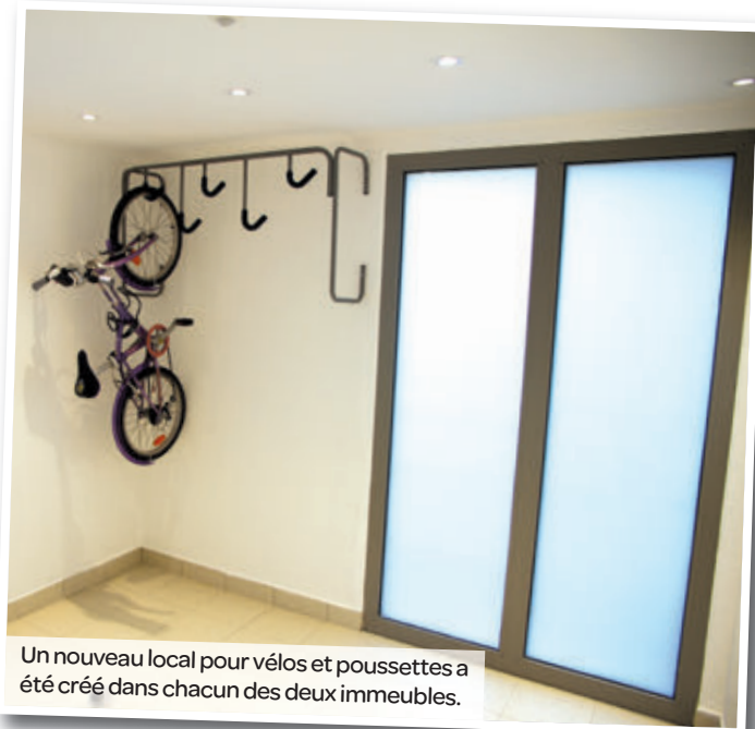
Un nouveau local pour vélos et poussettes a été créé dans chacun des deux immeubles.

pour vélos et poussettes pour chaque entrée et la réalisation d'un réaménagement complet des locaux communs. L'ensemble de ces travaux n'a engendré aucun coût supplémentaire sur les loyers et les charges des habitants.