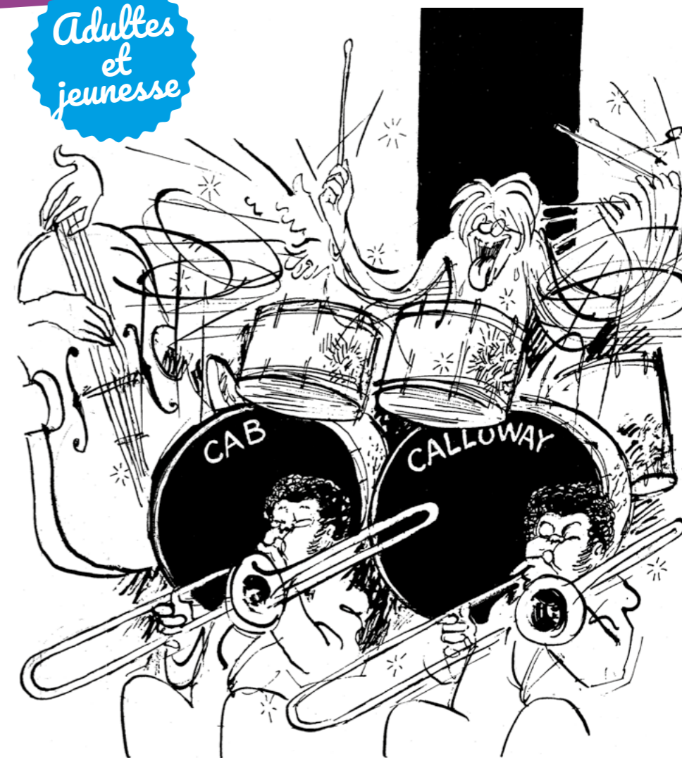
Dessin Cabu : © V. Cabut