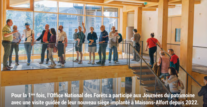
Pour la 1 ère fois, l'Office National des Forêts a participé aux Journées du patrimoine avec une visite guidée de leur nouveau siège implanté à Maisons-Alfort depuis 2022.