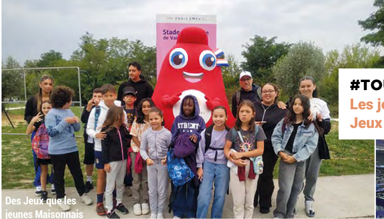
Des Jeux que les jeunes Maisonnais du dispositif Été Chaud ne sont pas près d'oublier !