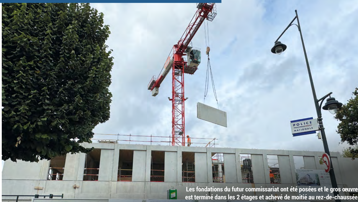
Les fondations du futur commissariat ont été posées et le gros œuvre est terminé dans les 2 étages et achevé de moitié au rez-de-chaussée.

Projet phare du mandat municipal 2020-2026, la vidéoprotection compte déjà 38 caméras installées aux abords des stations de métro, établissements scolaires et équipements municipaux. Une nouvelle phase de déploiement, actuellement en cours, s'achèvera en novembre prochain par le raccordement de 37 caméras supplémentaires, pour atteindre les 75 caméras promises.