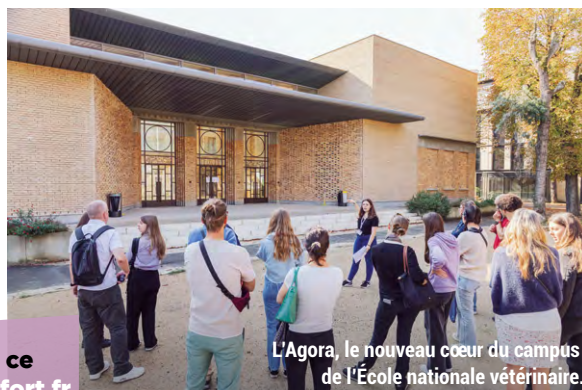
L'Agora, le nouveau cœur du campus de l'École nationale vétérinaire.