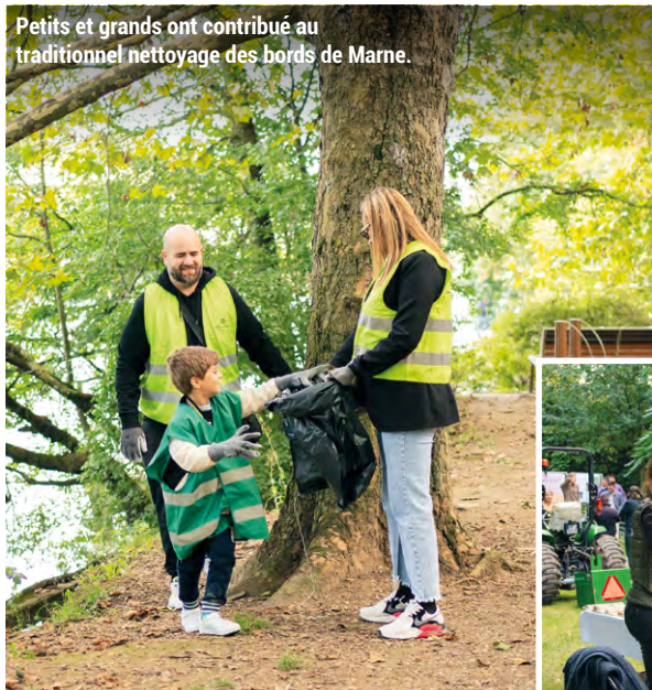
Petits et grands ont contribué au traditionnel nettoyage des bords de Marne.