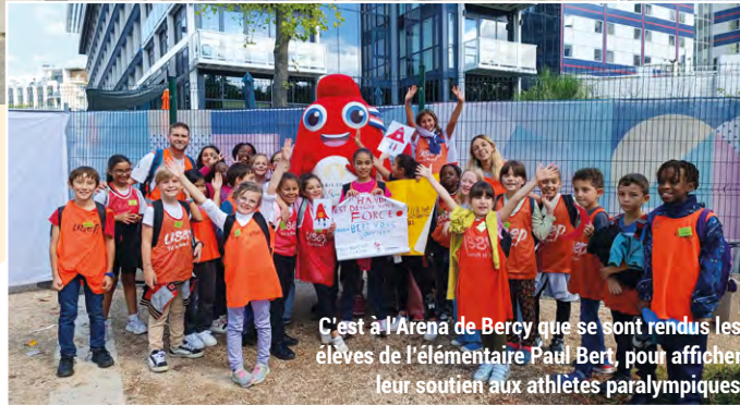
C'est à l'Arena de Bercy que se sont rendus les élèves de l'élémentaire Paul Bert, pour afficher leur soutien aux athlètes paralympiques.

Grâce au dispositif Été Chaud, les jeunes Maisonnais ont su garder la forme, tout au long de l'été ! Mais pas seulement... puisque la Ville leur a également offert la possibilité d'assister à certaines épreuves des Jeux Paralympiques ! Le 30 août, 122 Maisonnais ont ainsi assisté aux compétitions de para-athlétisme, l'occasion de franchir les portes du mythique stade de France, et de paraviron à Vaires-sur-Marne. Une belle manière de leur transmettre le goût