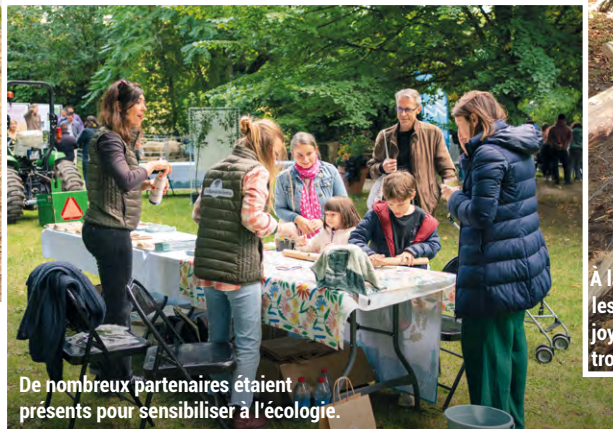
De nombreux partenaires étaient présents pour sensibiliser à l'écologie.