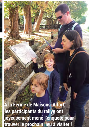
À la Ferme de Maisons-Alfort, les participants du rallye ont joyeusement mené l'enquête pour trouver le prochain lieu à visiter !