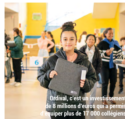
Ordival, c'est un investissement de 8 millions d'euros qui a permis d'équiper plus de 17 000 collégiens.