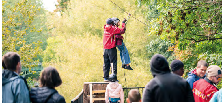
Grâce à la tyrolienne, plus besoin de pont pour traverser le bras de la Marne !