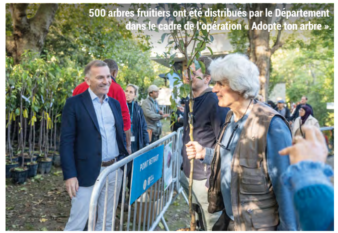
500 arbres fruitiers ont été distribués par le Département dans le cadre de l'opération « Adopte ton arbre ».

Si cet événement est désormais une tradition à Maisons-Alfort, cette 6 e édition a proposé de nombreuses nouveautés ! Une belle réussite puisque l'environnement sous toutes ses formes a fait l'actualité. Alors que la traditionnelle journée du samedi a attiré près de 1500 visiteurs – entre nettoyage des bords de Marne, visite de la centrale de géothermie des Juilliottes, stands et activités ludiques – le dimanche n'a pas été en reste ! Les près de 50 participants du nouveau rallye entre les équipements municipaux dédiés à l'écologie ont ainsi eu l'opportunité de visiter la serre pédagogique du parc du Vert de Maisons, la Ferme et le maraîchage municipal, entre autres. En parallèle, les 500 arbres fruitiers mis à la disposition par le département du Val-de-Marne dans le cadre de l'opération « Adopte ton arbre » ont trouvé de nouvelles familles, ravies de pouvoir verdifier leur jardin !