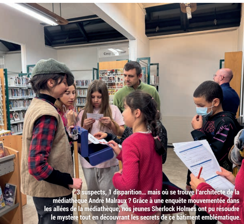
3 suspects, 1 disparition... mais où se trouve l'architecte de la médiathèque André Malraux ? Grâce à une enquête mouvementée dans les allées de la médiathèque, nos jeunes Sherlock Holmes ont pu résoudre le mystère tout en découvrant les secrets de ce bâtiment emblématique.