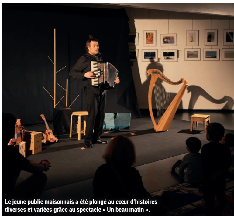
Le jeune public maison nais a été plongé au cœur d'histoires diverses et variées grâce au spectacle « Un beau matin ».