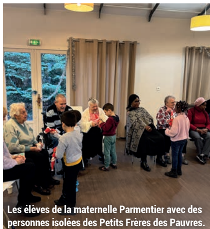
Les élèves de la maternelle Parmentier avec des personnes isolées des Petits Frères des Pauvres.

Les fêtes de fin d'année constituent autant de moments propices aux retrouvailles avec nos proches, mais également aux rencontres ! En décembre dernier, une classe de grande section de l'école maternelle Parmentier est ainsi allée à la rencontre de personnes isolées et âgées à l'occasion d'un goûter intergénérationnel organisé par l'équipe maisonnaise des Petits Frères des Pauvres. Après avoir interprété quelques chants de Noël pour le plus grand plaisir des seniors présents, les enfants ont partagé avec eux quelques douceurs. En janvier, la traditionnelle galette des Rois a également donné l'occasion aux élèves de la maternelle George Sand de rendre visite à leurs voisins de la résidence autonomie Les Arcades pour un petit spectacle musical. De beaux moments de vie, au cours desquels enfants et seniors ont eu l'occasion de discuter et d'apprendre les uns des autres.