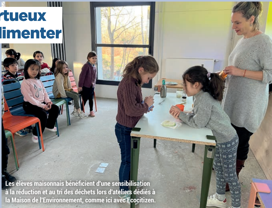
Les élèves maisonais bénéficient d'une sensibilisation à la réduction et au tri des déchets lors d'ateliers dédiés à la Maison de l'Environnement, comme ici avec Ecocitizen.

Réceptacles de tous les emballages sans distinction, les bacs jaunes se remplissent vite. Sachez que, selon vos besoins, le Territoire peut vous fournir des conteneurs jaunes d'une capacité de 240 litres, soit le double de celle de vos bacs actuels. N'hésitez donc pas à demander ces bacs jaunes qui vous seront livrés à votre domicile sous 48 h en envoyant un mail à livraison.bac@pemb.fr . Les anciens seront repris et recyclés.