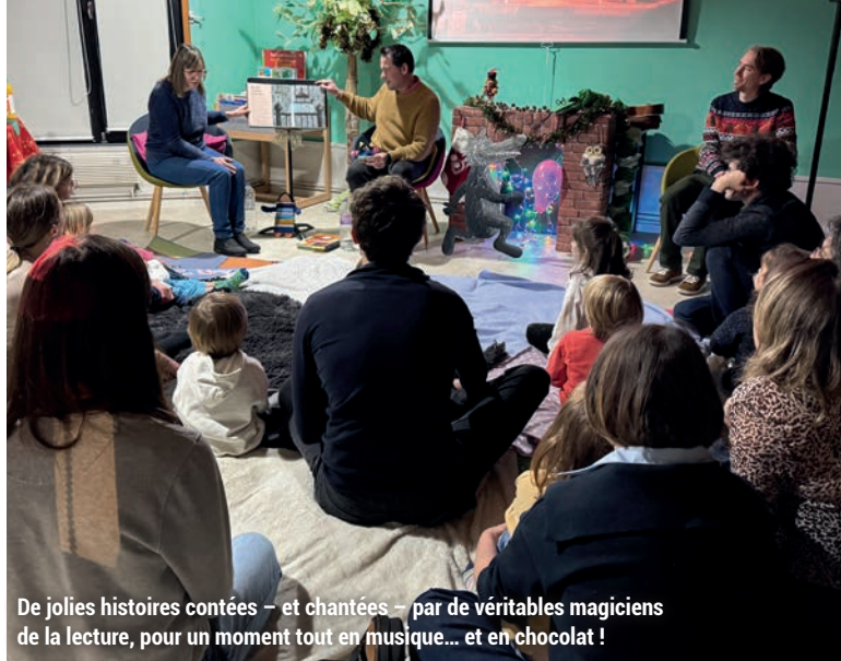
De jolies histoires contées – et chantées – par de véritables magiciens de la lecture, pour un moment tout en musique... et en chocolat !

Pour leur seconde participation, les médiathèques de la Ville ont proposé une programmation inédite au public maison nais dans le cadre de l'événement national « Les Nuits de la lecture » autour des « patrimoines », la thématique sélectionnée cette année. Le week-end des 24 et 25 janvier a ainsi été ponctué d'une veillée contée, d'un spectacle jeunesse ou encore d'un Escape Game pour transmettre le goût de la lecture aux jeunes et leur prouver qu'il ne s'agit pas uniquement d'une activité solitaire, mais bien d'un patrimoine qui se partage ! La preuve : l'événement s'est prolongé quelques jours plus tard au sein de l'élémentaire Jules Ferry grâce au concours des médiathécaires et de la directrice de l'établissement, M me Blanca.