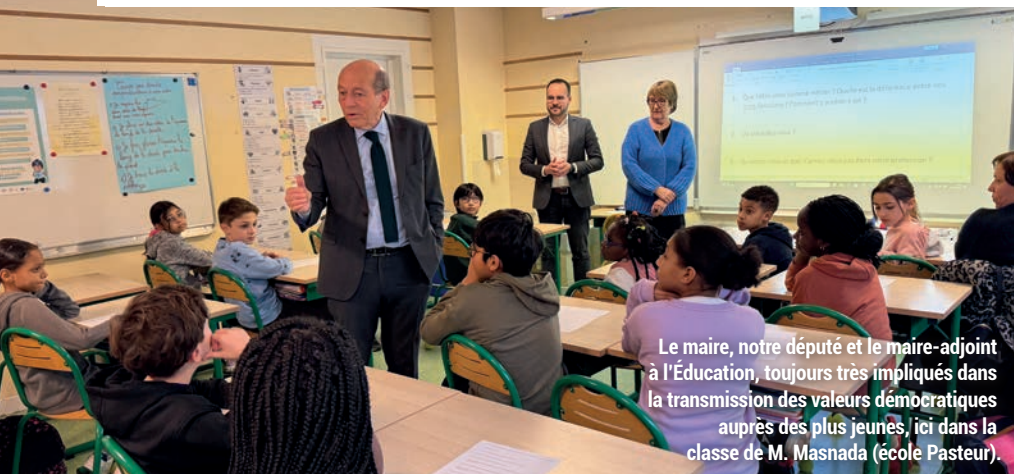
Le maire, notre député et le maire-adjoint à l'Éducation, toujours très impliqués dans la transmission des valeurs démocratiques auprès des plus jeunes, ici dans la classe de M. Masnada (école Pasteur).

La Ville de Maisons-Alfort se distingue par son programme de projets pédagogiques diversifié qu'elle propose gratuitement et dans un vaste champ thématique aux enfants scolarisés. Aussi, en ce début d'année, les projets s'enchaînent, participant à la construction de leur vie civique.