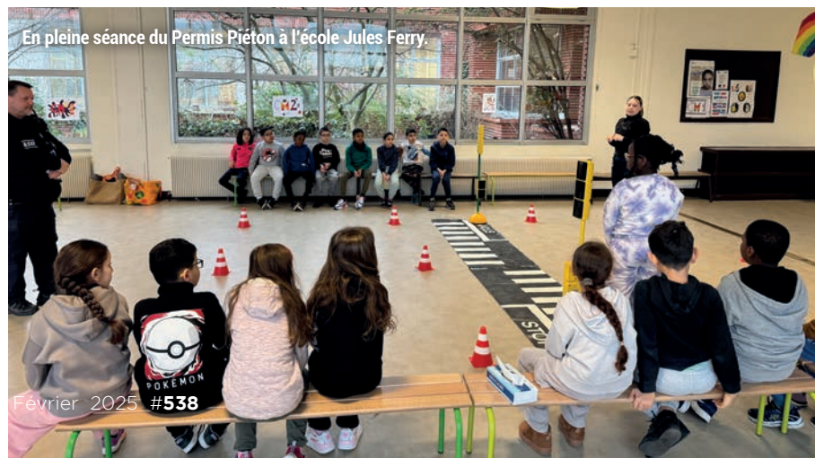
En pleine séance du Permis Piéton à l'école Jules Ferry.

Il n'y a pas qu'en patrouille que vous verrez les agents de la police municipale. Menés jusqu'ici par la police nationale, les dispositifs Permis Internet (CM2) et Permis Piéton (CE2) sont désormais abordés en classe, respectivement par les policiers municipaux et les Agents de Surveillance de la Voie Publique (ASVP). Un passage de flambeau qui fait sens pour les nouveaux intervenants pour qui la prévention fait partie intégrante de leurs missions de sécurité quotidiennes. Au total, 1 059 élèves vont bénéficier de ces deux formations cette année.