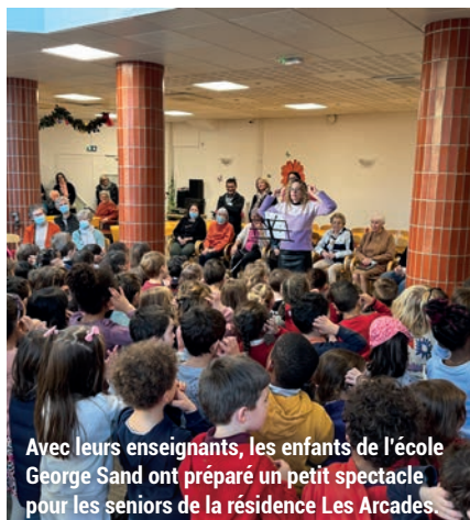
Avec leurs enseignants, les enfants de l'école George Sand ont préparé un petit spectacle pour les seniors de la résidence Les Arcades.