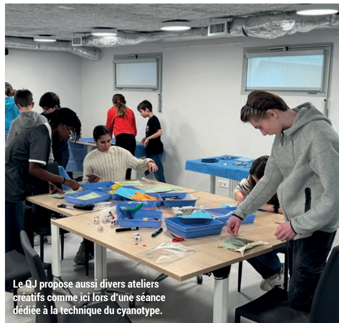
Le QJ propose aussi divers ateliers créatifs comme ici lors d'une séance dédiée à la technique du cyanotype.