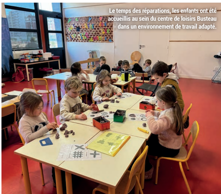
Le temps des réparations, les enfants ont été accueillis au sein du centre de loisirs Busteau dans un environnement de travail adapté.

Une rupture de canalisation survenue le 9 janvier dans le sous-sol de la maternelle Édouard Herriot a causé d'importants dégâts qui ont impacté la chaufferie et le réseau électrique. Les locaux scolaires n'ont heureusement pas été touchés. Un dispositif exceptionnel d'accueil a ainsi été mis en place au sein du centre de loisirs élémentaire Busteau, situé à deux pas de l'école. « Dès le lendemain, les enfants ont été accueillis dans un espace d'enseignement aménagé au plus près de leurs habitudes, avec du mobilier adapté, grâce à la mobilisation des services de la Ville, de l'équipe pédagogique de l'école et la Direction de l'Éducation nationale, rappelle le maire-adjoint à l'Éducation, Romain Maria. Il était primordial d'assurer la continuité pédagogique. » « Je tiens à saluer la réactivité des services municipaux dans la gestion de cette situation urgente », a souligné M me Vargas, directrice de la maternelle Édouard Herriot. Grâce à la grande réactivité des équipes techniques de la Ville et de ses partenaires, les travaux nécessaires ont pu être effectués dans les plus brefs délais, permettant d'organiser le réaménagement des locaux dès le 1 er février. Les enfants ont ainsi pu regagner leur établissement scolaire le lundi 3 février dans des conditions optimales.