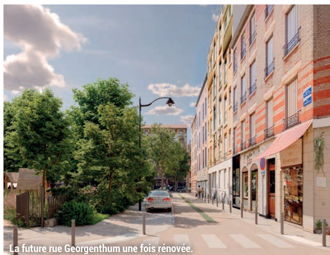
La future rue Georgenthum une fois rénovée.

La rue bénéficiera ainsi d'une réfection totale, ses trottoirs seront agrandis , tandis que des jardinières seront créées tout au long de la clôture, qui sera restaurée avec le remplacement des portails d'accès et l'ajout d'une entrée au niveau de cette rue . Des pavés enherbés seront posés au centre de la chaussée pour permettre