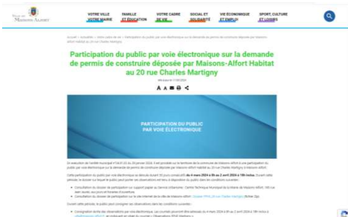
Capture d'écran du site Internet – 12/03/2024

Des renseignements complémentaires sur la procédure pouvaient être obtenus auprès du Service Urbanisme au 165 rue Jean Jaurès 94700 MAISONS-ALFORT, par courriel à secretariat.urbanisme@maisons-alfort.fr ou par téléphone au 01.43.96.77.30.