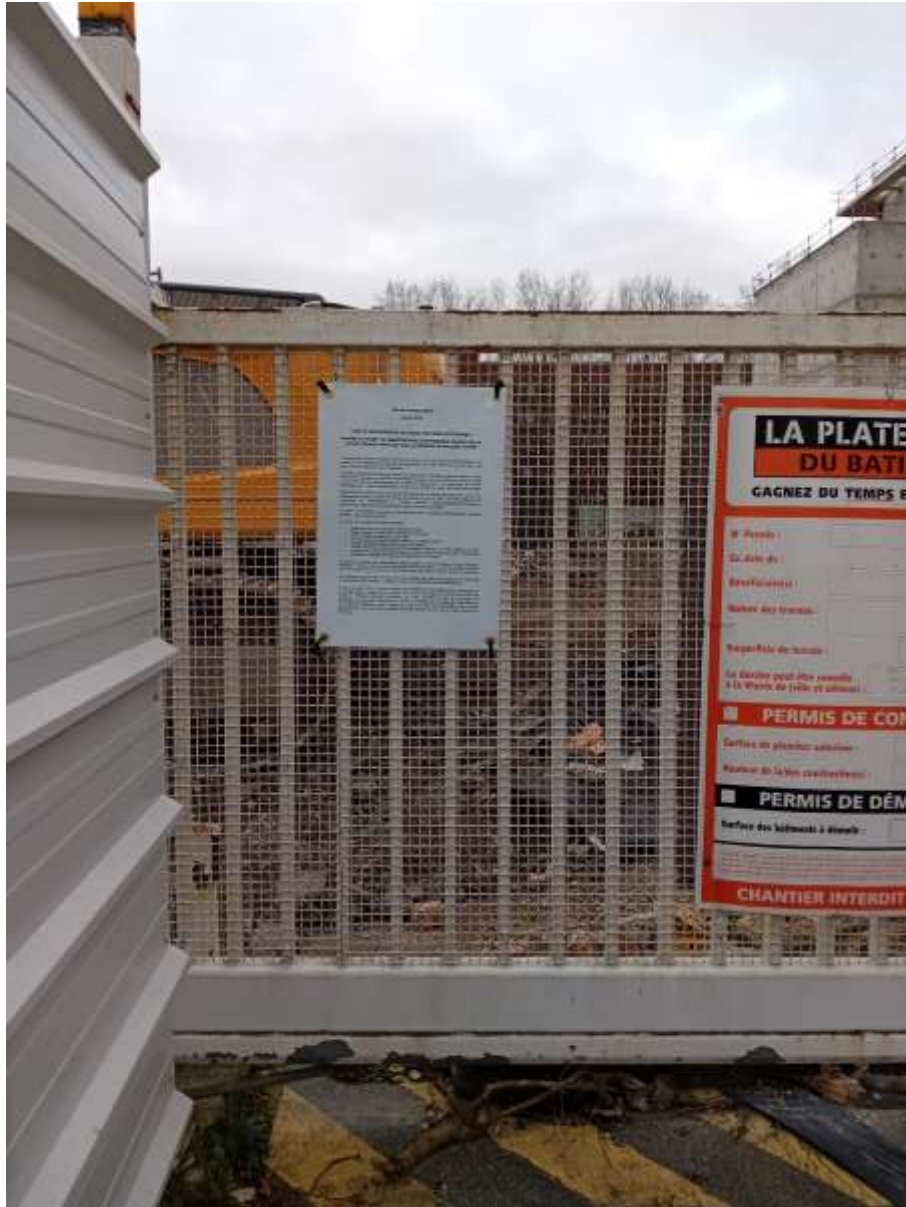
Affiche sur site 1/4

Conformément à l'article R.123-9 du Code de l'Environnement, un affichage légal a été opéré sur le territoire communal du 16 février 2024 au 1 er mars 2024 inclus, sur site (4 affiches, 2 sur la rue Jean Jaurès et 2 sur la rue Charles Martigny, au droit du projet) et à l'accueil du Service Urbanisme.