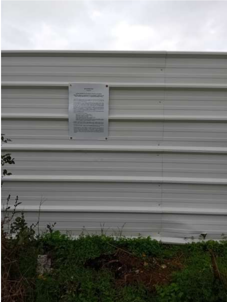
Affiche sur site 4/4