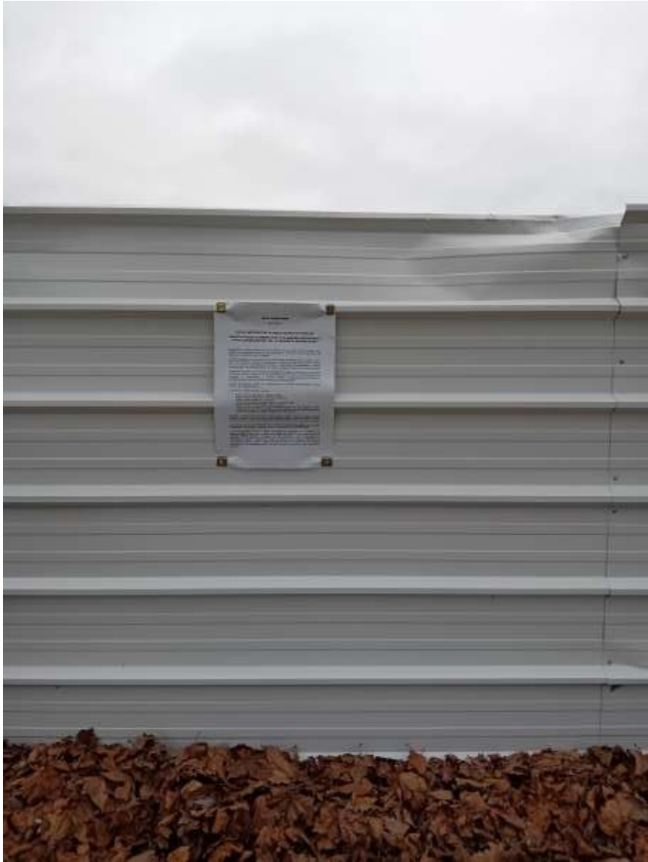
Affiche sur site 2/4