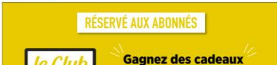
Le Parisien – Annonce du 16 février 2024