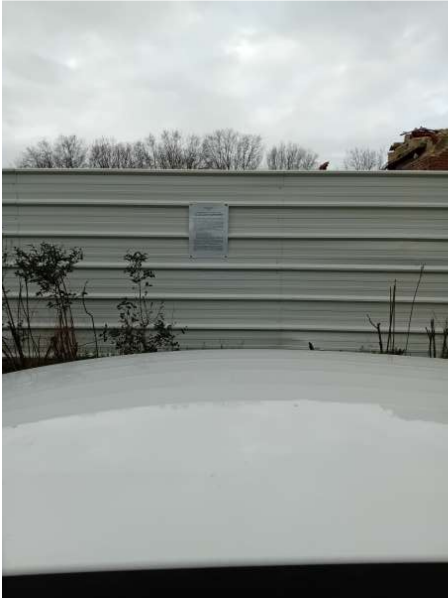
Affiche sur site 3/4