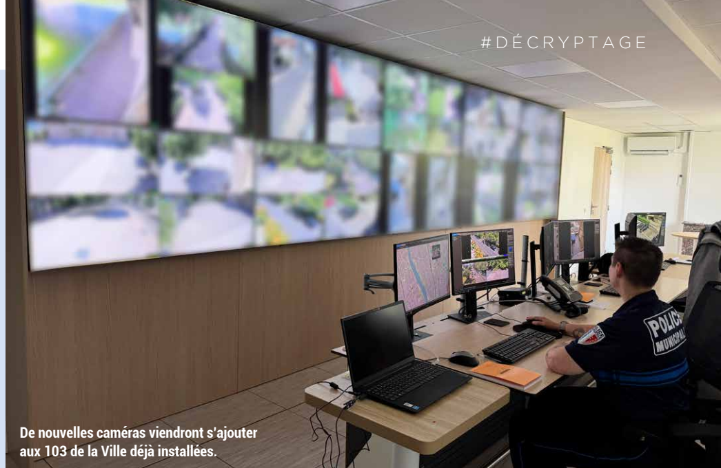
De nouvelles caméras viendront s'ajouter aux 103 de la Ville déjà installées.

Depuis le printemps 2025, la police municipale bénéficie de nouveaux locaux plus modernes et adaptés aux besoins des usagers, complétés par la création d'un Centre de Supervision Urbain (CSU) relié aux 103 caméras de vidéosurveillance implantées dans tous les quartiers. En plus de l'extension du réseau de caméras, les équipes de police municipale seront également renforcées par le recrutement de nouveaux agents. Le budget global alloué à la sécurité bénéficie d'une hausse de 2,8 % en 2026 , soit plus de 2,85 millions d'euros de fonctionnement, dont 1,14 million pour la police municipale.