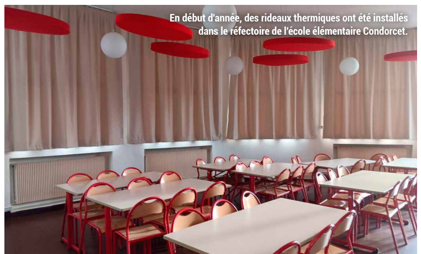
En début d'année, des rideaux thermiques ont été installés dans le réfectoire de l'école élémentaire Condorcet.

Le budget alloué à la Maison de l'Environnement, qui accueille chaque année plus de 200 ateliers dédiés à l'écologie, bénéficie en 2026 d'une augmentation de 15 000 € , soit un budget total de 115 000 € cette année.