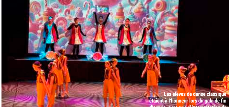
Les élèves de danse classique étaient à l'honneur lors du gala de fin d'année, avec une réinterprétation de Casse-Noisette .