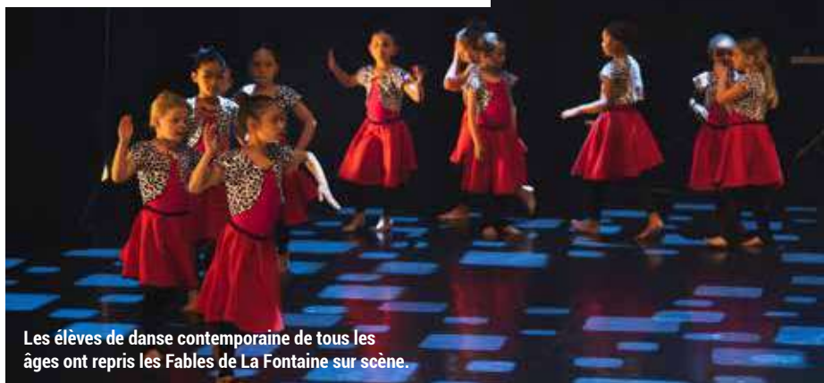
Les élèves de danse contemporaine de tous les âges ont repris les Fables de La Fontaine sur scène.