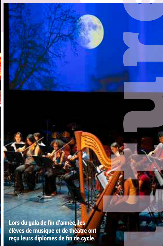
Lors du gala de fin d'année, les élèves de musique et de théâtre ont reçu leurs diplômes de fin de cycle.

C'est un moment que les élèves du conservatoire municipal Henri Dutilleux attendent chaque année avec impatience – et une pointe d'appréhension ! Tout au long du mois de juin, les élèves de chant, de danse et de musique ont en effet investi la scène du théâtre Claude Debussy, dévoilant au public maisonnaï des spectacles inédits. Les élèves de danse contemporaine de Jeanne Perez ont ainsi inauguré cette série de spectacles, avec une interprétation dansée des Fables de La Fontaine . Après