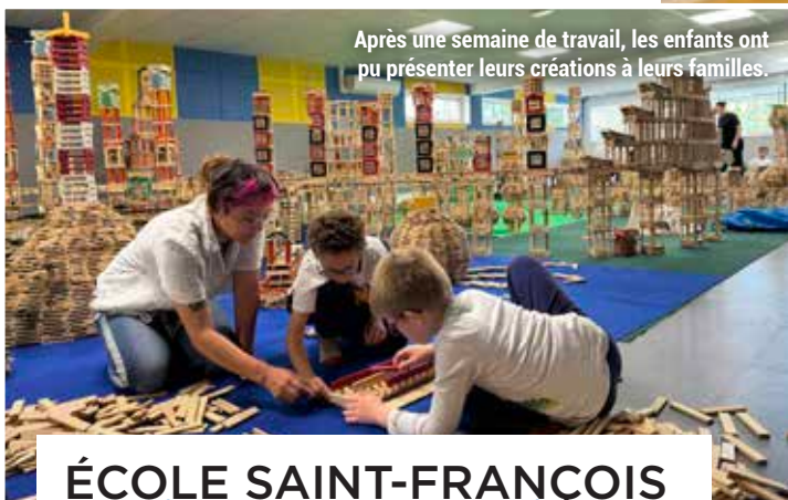
Après une semaine de travail, les enfants ont pu présenter leurs créations à leurs familles.