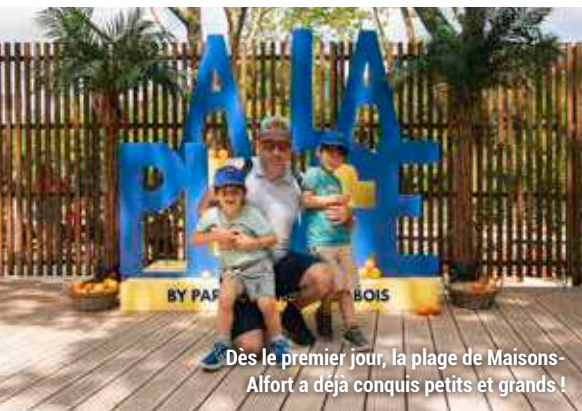
Dès le premier jour, la plage de Maisons-Alfort a déjà conquis petits et grands !

Grâce au retour de la plage maisonnaise, nous souhaitons offrir aux familles un nouvel espace de détente et de loisirs au bord de la Marne. Comme un air de vacances au cœur de la ville.