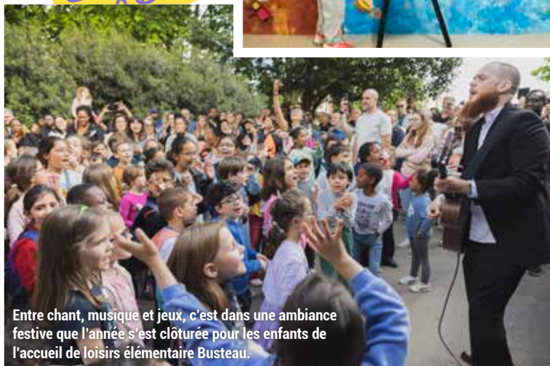
Entre chant, musique et jeux, c'est dans une ambiance festive que l'année s'est clôturée pour les enfants de l'accueil de loisirs élémentaire Busteau.