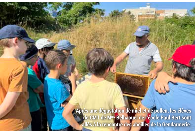
Après une dégustation de miel et de pollen, les élèves de CM1 de M me Belhaouel de l'école Paul Bert sont allés à la rencontre des abeilles de la Gendarmerie.

blanc qui permet de se protéger pour récolter le miel – avant une dégustation bien méritée !