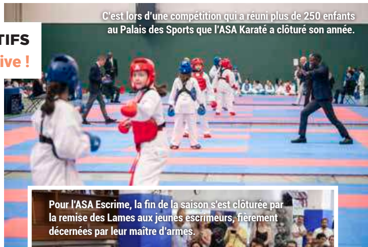
C'est lors d'une compétition qui a réuni plus de 250 enfants au Palais des Sports que l'ASA Karaté a clôturé son année.

Une fin de saison en beauté, qui sonne le début de la traditionnelle pause de l'été, avant une reprise active dès le 7 septembre lors du Forum des associations !