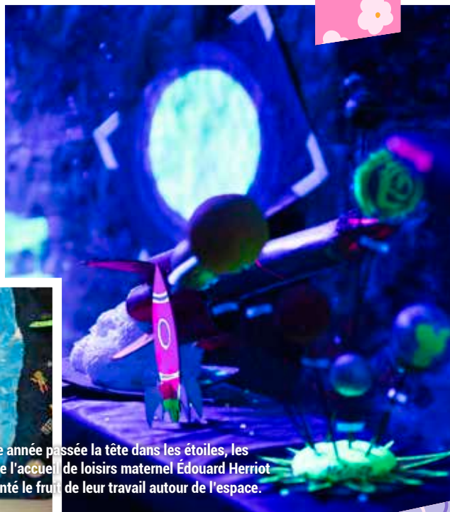
Après une année passée la tête dans les étoiles, les enfants de l'accueil de loisirs maternel Édouard Herriot ont présenté le fruit de leur travail autour de l'espace.

Crèches, écoles maternelles, élémentaires et accueils de loisirs... tous les enfants ont profité de la fin de l'année pour célébrer l'arrivée de l'été. Ils ont invité leurs parents à découvrir leur univers quotidien et le travail mené tout au long de l'année avec les équipes pédagogiques. C'est autour d'activités, de jeux et de spectacles que tous se sont retrouvés dans les différentes structures. Une belle manière de renforcer les liens entre tous les acteurs éducatifs.