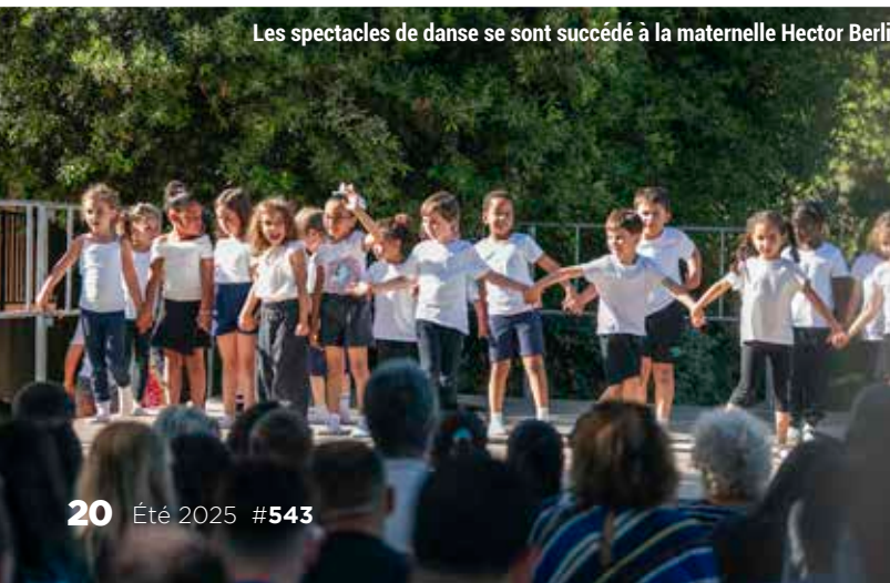
Les spectacles de danse se sont succédé à la maternelle Hector Berlioz !