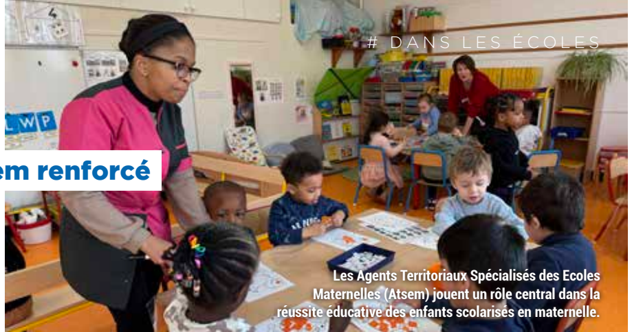
Les Agents Territoriaux Spécialisés des Ecoles Maternelles (Atsem) jouent un rôle central dans la réussite éducative des enfants scolarisés en maternelle.