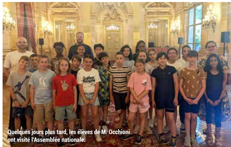
Quelques jours plus tard, les élèves de M. Occhioni ont visité l'Assemblée nationale.