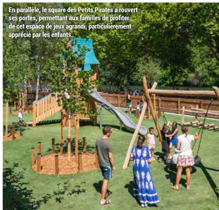
En parallèle, le square des Petits Pirates a rouvert ses portes, permettant aux familles de profiter de cet espace de jeux agrandi, particulièrement apprécié par les enfants.