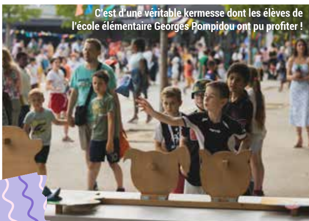
C'est d'une véritable kermesse dont les élèves de l'école élémentaire Georges Pompidou ont pu profiter !