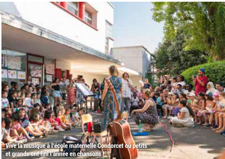
Vive la musique à l'école maternelle Condorcet où petits et grands ont fini l'année en chansons !