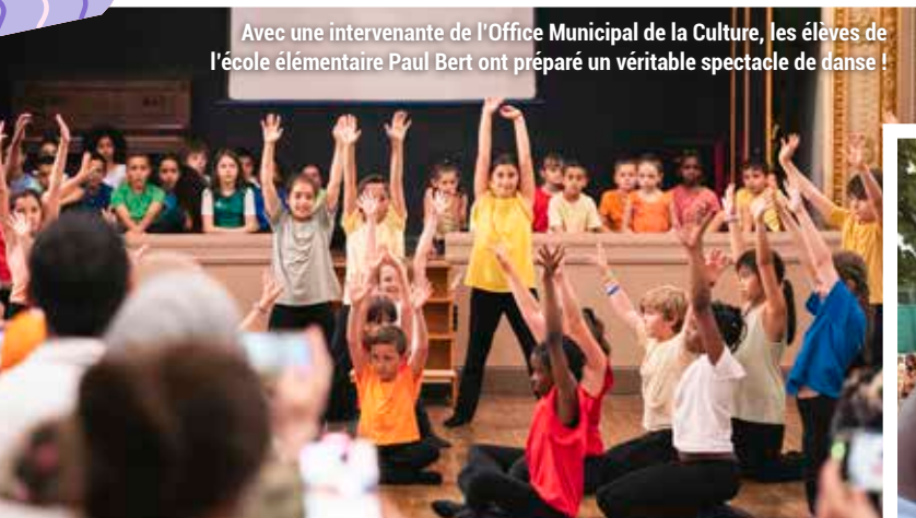
Avec une intervenante de l'Office Municipal de la Culture, les élèves de l'école élémentaire Paul Bert ont préparé un véritable spectacle de danse !