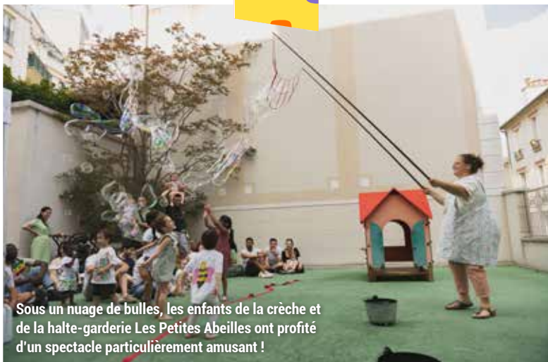
Sous un nuage de bulles, les enfants de la crèche et de la halte-garderie Les Petites Abeilles ont profité d'un spectacle particulièrement amusant !