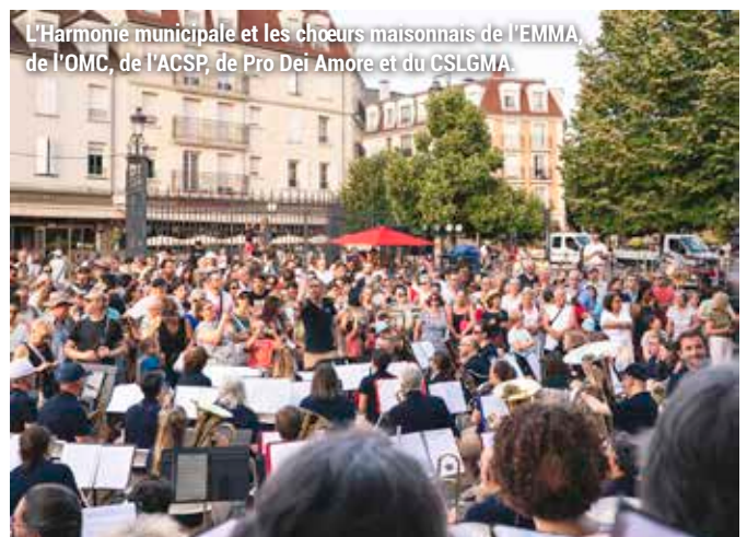
L'Harmonie municipale et les chœurs maisonnis de l'EMMA, de l'OMC, de l'ACSP, de Pro Dei Amore et du CSLGMA.