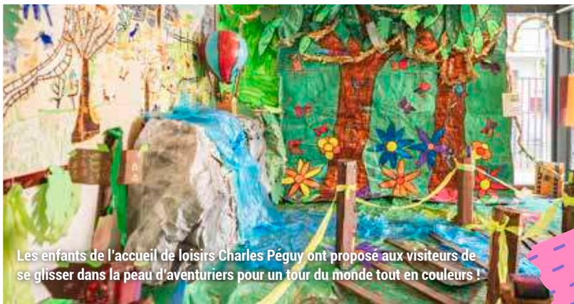
Les enfants de l'accueil de loisirs Charles Péguy ont proposé aux visiteurs de se glisser dans la peau d'aventuriers pour un tour du monde tout en couleurs !