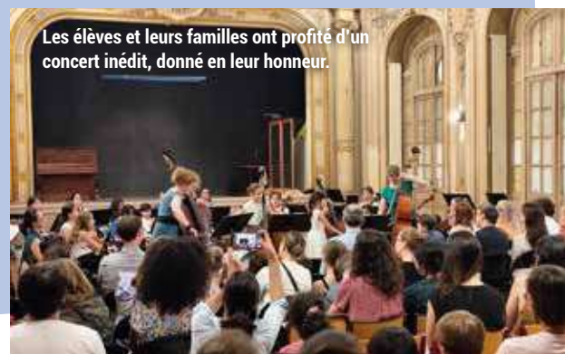
Les élèves et leurs familles ont profité d'un concert inédit, donné en leur honneur.

Le 12 juin dernier, les élèves de l'école Paul Bert, accompagnés par leurs familles, ont assisté à un concert de l'orchestre à cordes du conservatoire Henri Dutilleux, dans la salle de spectacle de leur école. Un bel échange qui aura permis aux enfants de découvrir le talent de jeunes musiciens du conservatoire et aux musiciens de se produire devant un public réuni en nombre, à quelques jours de leur gala de fin d'année.