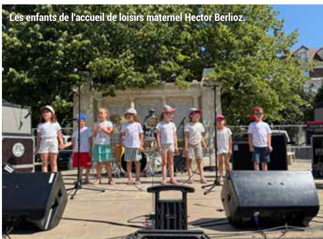
Les enfants de l'accueil de loisirs maternel Hector Berlioz.