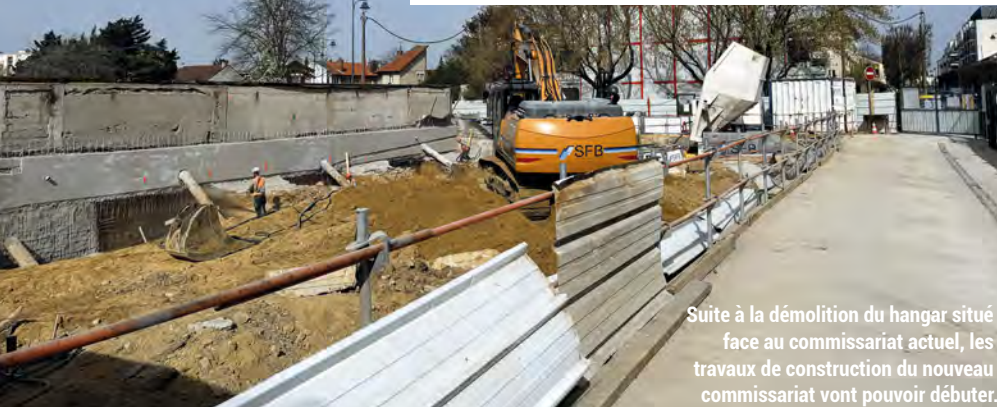
Suite à la démolition du hangar situé face au commissariat actuel, les travaux de construction du nouveau commissariat vont pouvoir débuter.

Initiée en début d'année, la démolition du hangar technique et du pavillon jusqu'alors situés face à l'actuel commissariat de police nationale a pris fin. À l'issue de cette première étape, les travaux de construction du nouveau commissariat vont pouvoir débuter. Ainsi, les travaux de terrassement ont été lancés à la fin mars pour se terminer début juillet et permettre la création des fondations puis le lancement des travaux du clos ouvert. Ce projet, pour lequel la Ville est mobilisée de longue date, a débuté grâce à la signature d'une convention de construction entre la Ville et l'État, en février 2022. Les travaux devraient prendre fin en décembre 2025 pour un déménagement des locaux de police prévu en début d'année 2026.