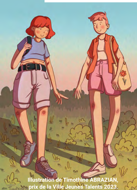
Illustration de Timothine ABRAZIAN, prix de la Ville Jeunes Talents 2023.