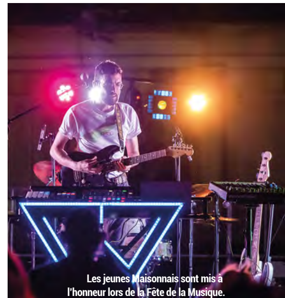
Les jeunes Maisonnois sont mis à l'honneur lors de la Fête de la Musique.

La Ville offre l'opportunité aux jeunes Maisonnois de se produire sur scène lors de la Fête de la Musique. Il y a également les représentations « Hors les Murs » du conservatoire auxquelles de nombreux jeunes participent chaque année, dans divers styles musicaux.