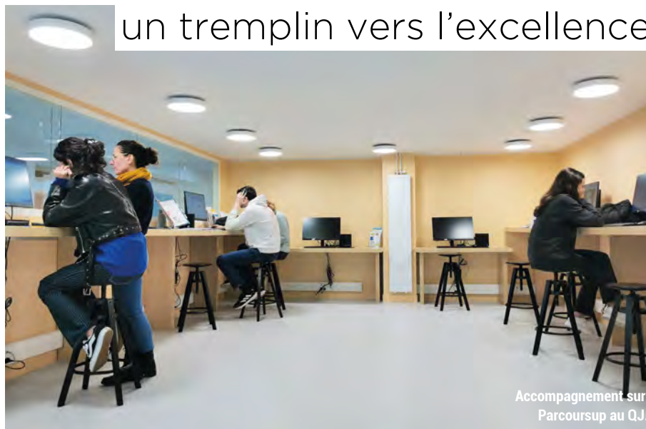
Accompagnement sur Parcoursup au QJ.