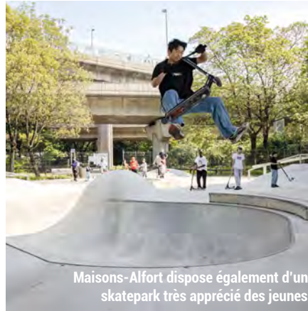
Maisons-Alfort dispose également d'un skatepark très apprécié des jeunes.

Besoin de se défouler ? Outre les nombreux équipements sportifs, 4 dispositifs gratuits sont spécifiquement dédiés aux jeunes :