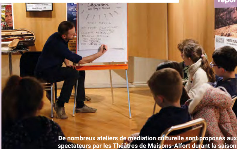
De nombreux ateliers de médiation culturelle sont proposés aux spectateurs par les Théâtres de Maisons-Alfort durant la saison.