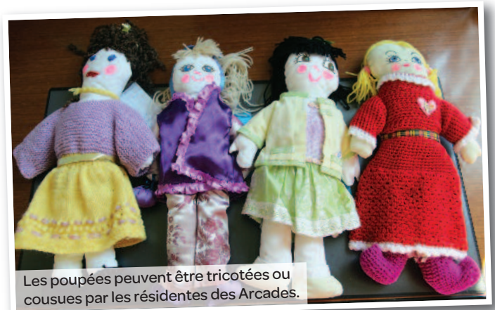
Les poupées peuvent être tricotées ou cousues par les résidentes des Arcades.

Grâce à la vente d'une poupée frimousse, l'Unicef peut recueillir assez d'argent pour vacciner un enfant contre 5 maladies infantiles, souvent contagieuses et parfois mortelles : rougeole, coqueluche, varicelle, scarlatine et poliomyélite. Ainsi, chaque poupée frimousse créée et achetée protège la vie d'un enfant.