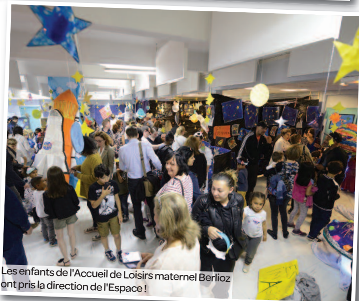
Les enfants de l'Accueil de Loisirs maternel Berlioz ont pris la direction de l'Espace !