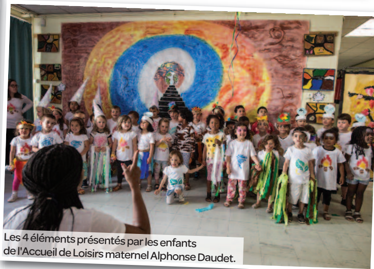
Les 4 éléments présentés par les enfants de l'Accueil de Loisirs maternel Alphonse Daudet.