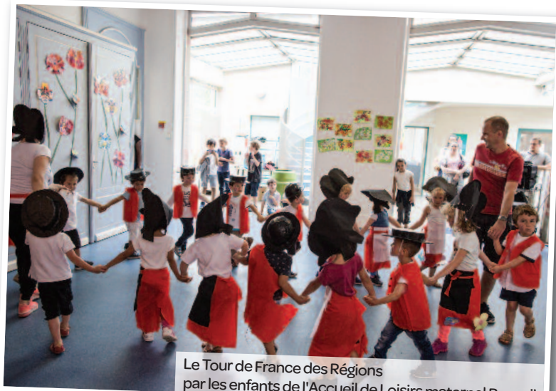
Le Tour de France des Régions par les enfants de l'Accueil de Loisirs maternel Raspail.