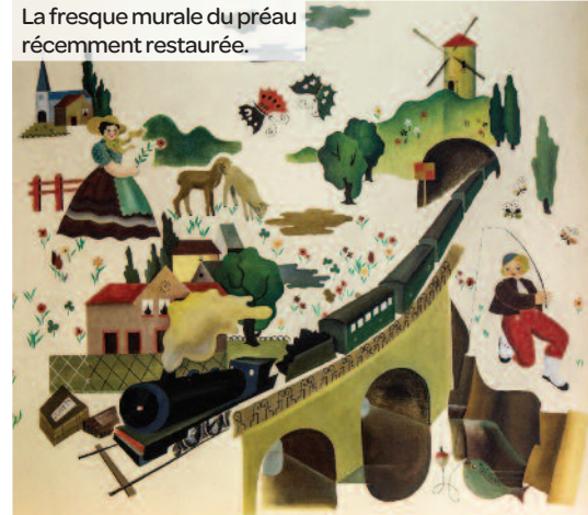
La fresque murale du préau récemment restaurée.