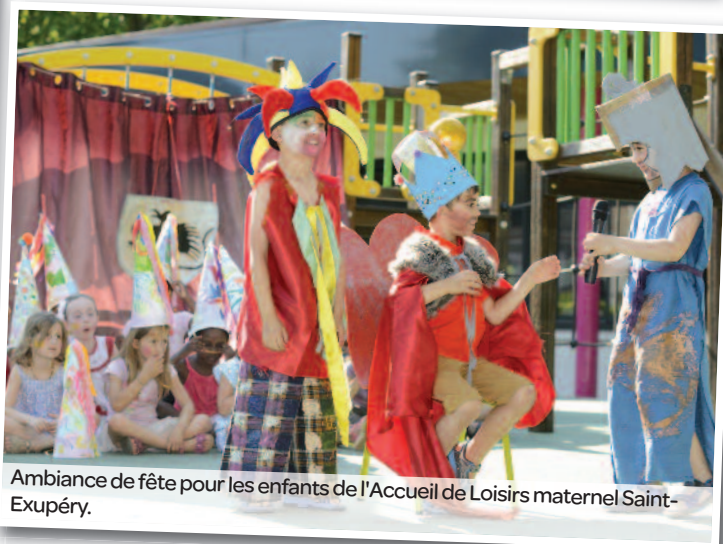
Ambiance de fête pour les enfants de l'Accueil de Loisirs maternel Saint-Exupéry.