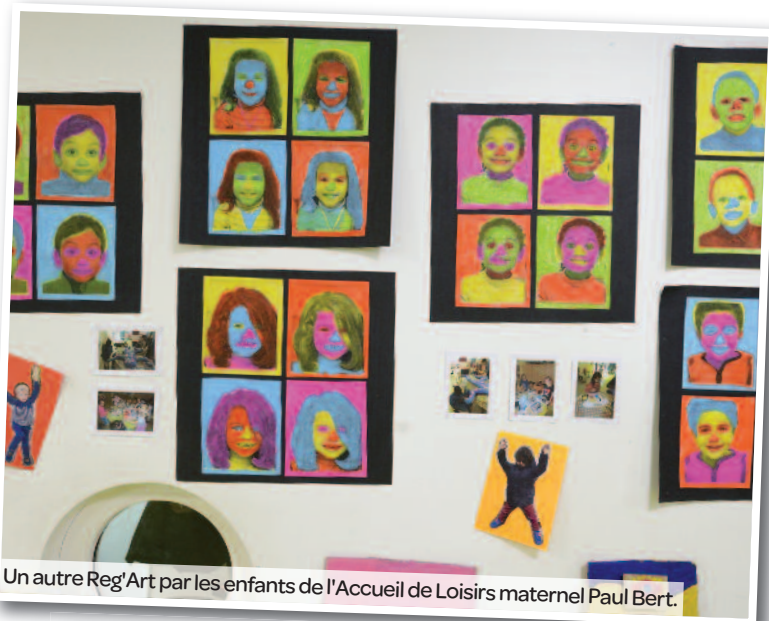
Un autre Reg'Art par les enfants de l'Accueil de Loisirs maternel Paul Bert.