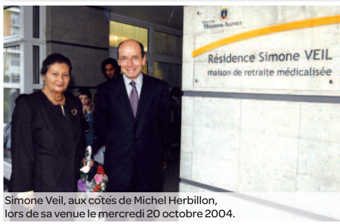
Simone Veil, aux côtés de Michel Herbillon, lors de sa venue le mercredi 20 octobre 2004.

En son honneur, une minute de silence fut observée lors de l'ouverture du Conseil Municipal de notre Ville le dimanche 2 juillet dernier.