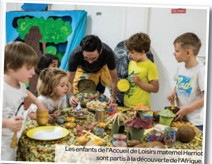
Les enfants de l'Accueil de Loisirs maternel Herriot sont partis à la découverte de l'Afrique.