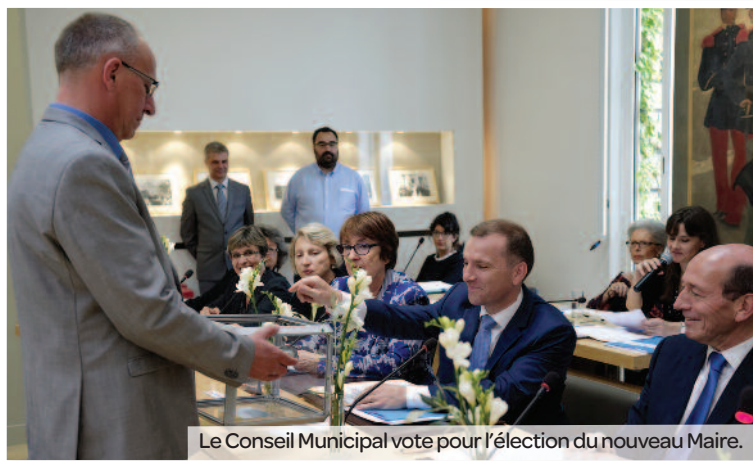
Le Conseil Municipal vote pour l'élection du nouveau Maire.