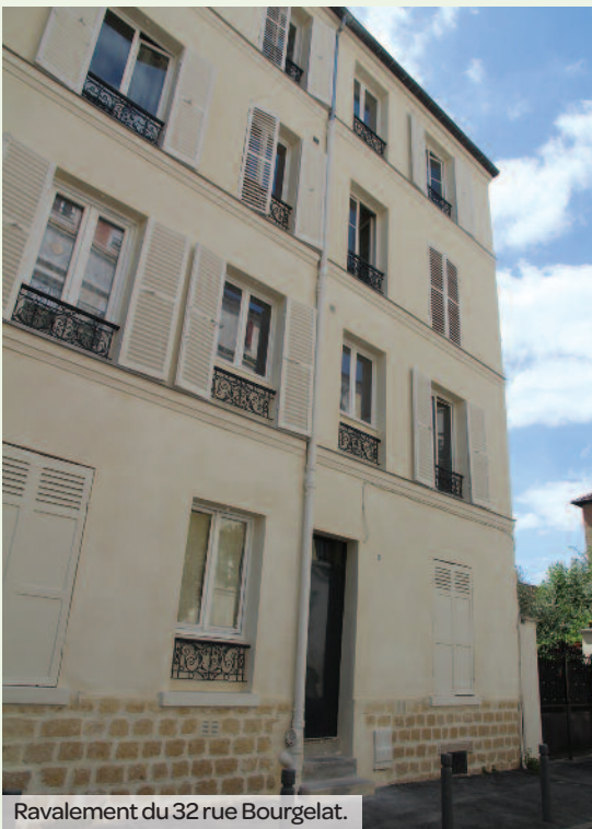
Ravalement du 32 rue Bourgelat.