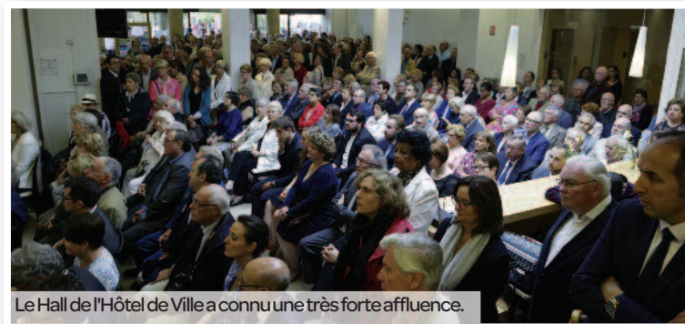
Le Hall de l'Hôtel de Ville a connu une très forte affluence.