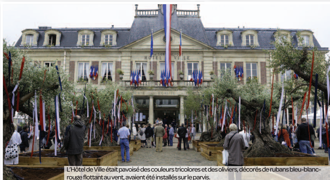
L'Hôtel de Ville était pavaisé des couleurs tricolores et des oliviers, décorés de rubans bleu-blanc-rouge flottant au vent, avaient été installés sur le parvis.