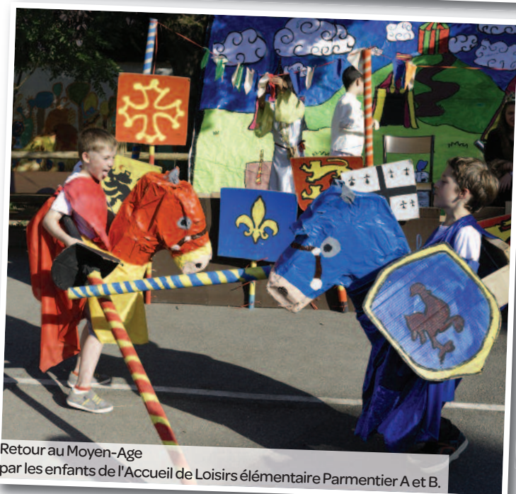
Retour au Moyen-Age par les enfants de l'Accueil de Loisirs élémentaire Parmentier A et B.