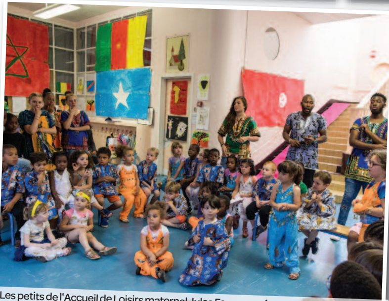
Les petits de l'Accueil de Loisirs maternel Jules Ferry se préparent pour la chorale.