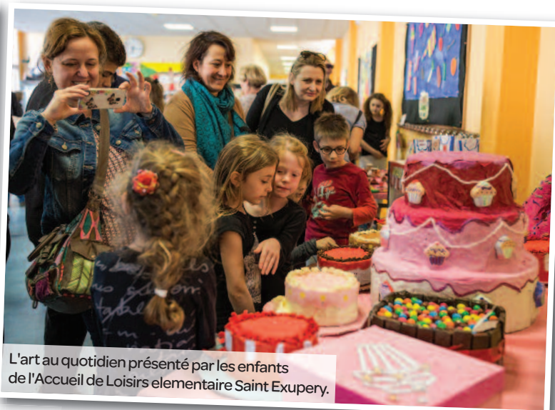
L'art au quotidien présenté par les enfants de l'Accueil de Loisirs élémentaire Saint Exupéry.