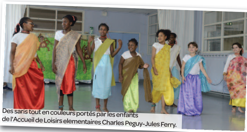
Des saris tout en couleurs portés par les enfants de l'Accueil de Loisirs élémentaires Charles Peguy-Jules Ferry.

Pour rappel, la Ville de Maisons-Alfort organise 17 accueils de loisirs tous les mercredis avec une équipe d'animateurs qui ont accueilli cette année près de 1000 enfants.