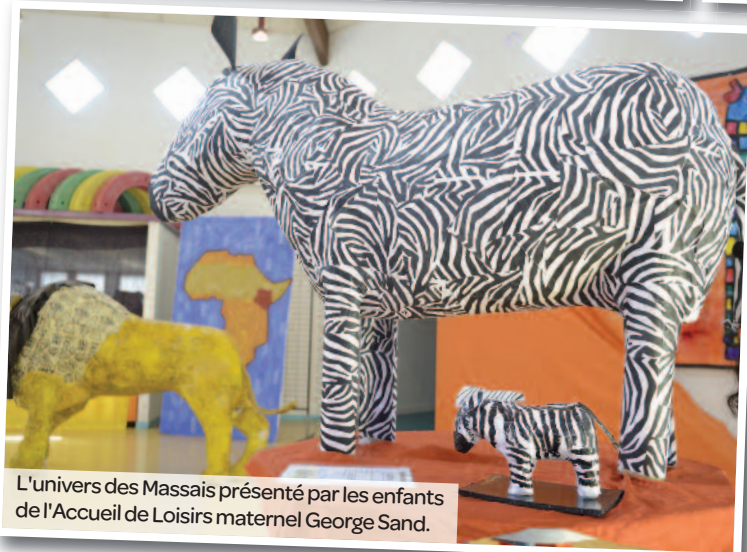
L'univers des Massais présenté par les enfants de l'Accueil de Loisirs maternel George Sand.