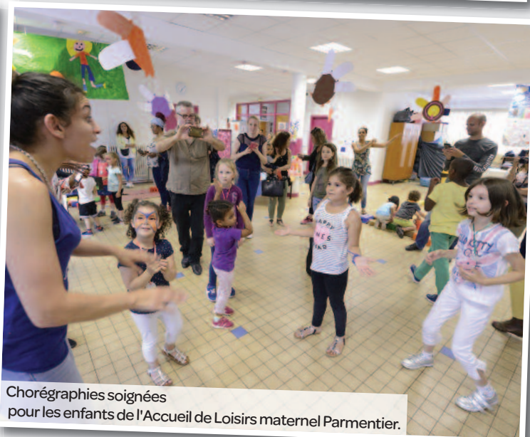
Chorégraphies soignées pour les enfants de l'Accueil de Loisirs maternel Parmentier.