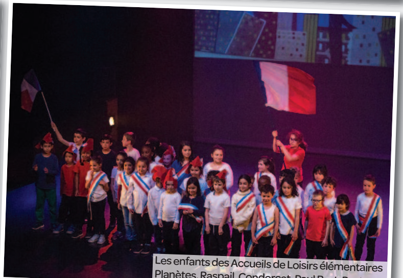
Les enfants des Accueils de Loisirs élémentaires Planètes, Raspail, Condorcet, Paul Bert, Pasteur.