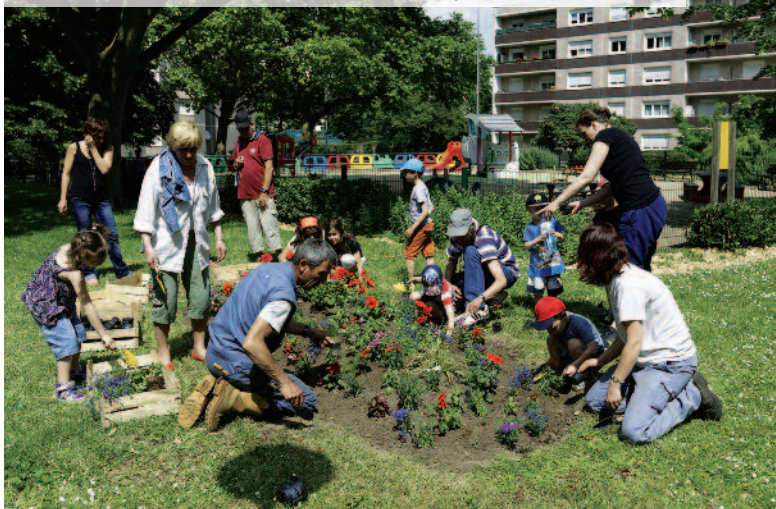
La bonne humeur était au rendez-vous de cet après-midi 100 % nature.

joies du jardinage, de la plantation à l'arrosage en passant par le ratissage.