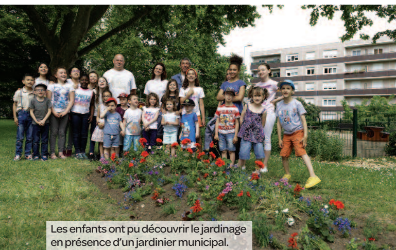
Les enfants ont pu découvrir le jardinage en présence d'un jardinier municipal.