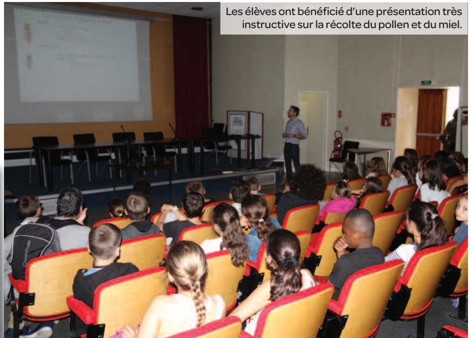
Les élèves ont bénéficié d'une présentation très instructive sur la récolte du pollen et du miel.

Mené par la Ville de Maisons-Alfort depuis 8 ans, le parcours éco-citoyen vise à enseigner aux écoliers maisonnaires les règles de préservation de l'environnement sous une approche ludique. Suite à la création de la section Apiculture du Club Sportif et de Loisirs de la Gendarmerie de Maisons-Alfort (CSLGMA), une animation consacrée aux abeilles est venue enrichir en 2016 les nombreux ateliers déjà