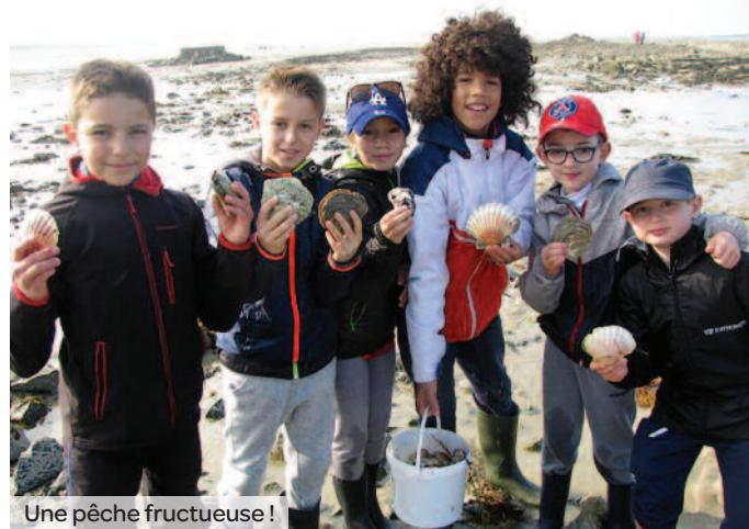
Une pêche fructueuse !

Pendant une dizaine de jours, les 60 écoliers maisonnaux, accompagnés de leur enseignant et de 4 animateurs ont bénéficié d'un programme historique et culturel très riche, avec notamment une série de visites guidées très attractives : Mémorial de la Paix à Caen, vestiges du Mur de l'Atlantique à Azeville, Musée commémoratif