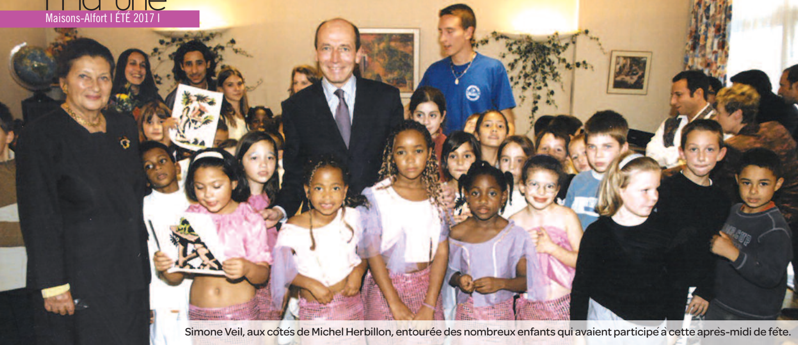
Simone Veil, aux côtés de Michel Herbillon, entourée des nombreux enfants qui avaient participé à cette après-midi de fête.