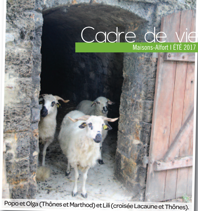
Popo et Olga (Thônes et Marthod) et Lili (croisée Lacaune et Thônes).