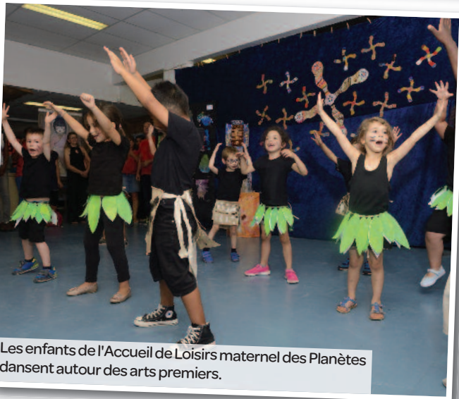
Les enfants de l'Accueil de Loisirs maternel des Planètes dansent autour des arts premiers.