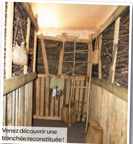
Venez découvrir une tranchée reconstituée !

Consignes de sécurité pour l'accès au Fort de Charenton : voir le site internet de la Ville : www.maisons-alfort.fr