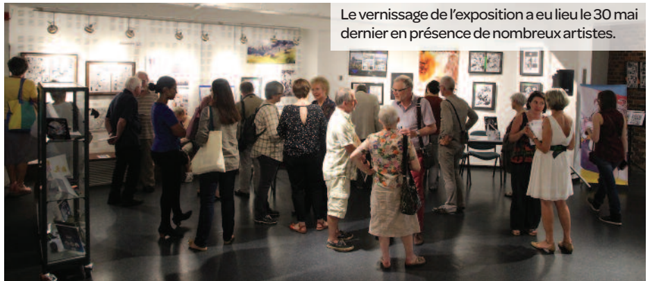
Le vernissage de l'exposition a eu lieu le 30 mai dernier en présence de nombreux artistes.