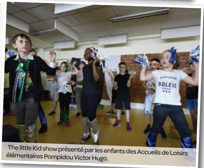
The little Kid show présenté par les enfants des Accueils de Loisirs élémentaires Poincaré Victor Hugo.