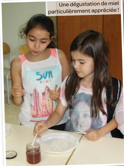
Une dégustation de miel particulièrement appréciée !