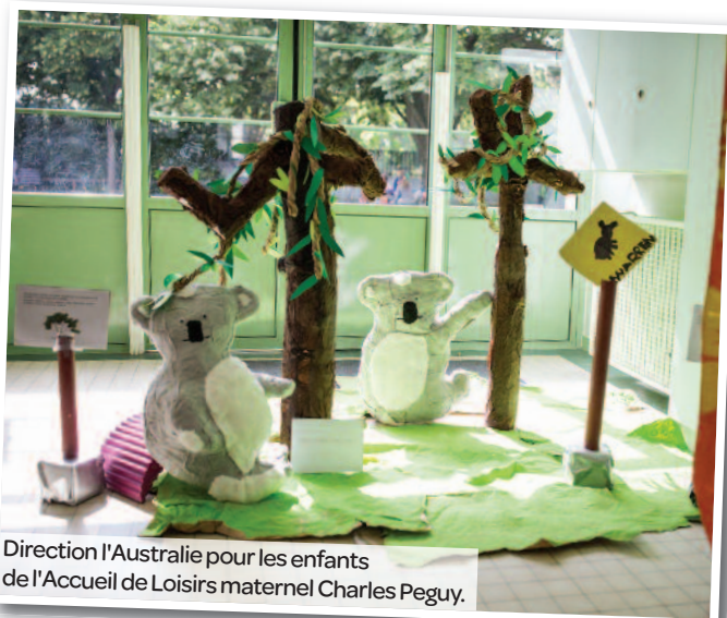
Direction l'Australie pour les enfants de l'Accueil de Loisirs maternel Charles Peguy.