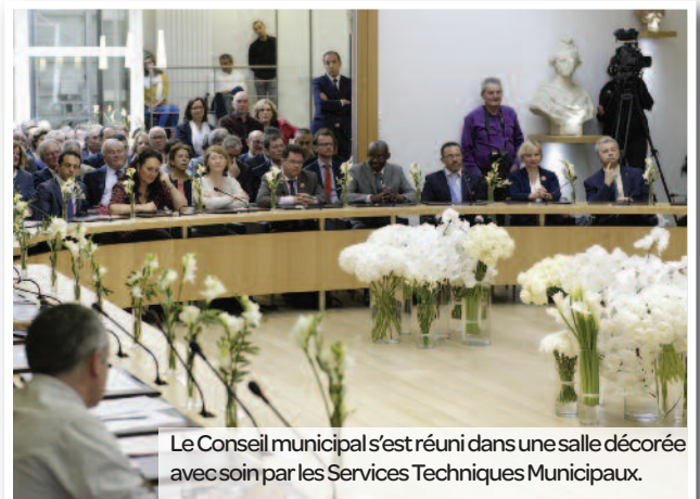
Le Conseil municipal s'est réuni dans une salle décorée avec soin par les Services Techniques Municipaux.