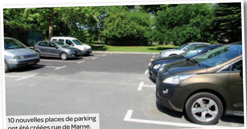
10 nouvelles places de parking ont été créées rue de Marne.

Ainsi, 10 places de stationnement supplémentaires ont été créées à cet emplacement pour faciliter le quotidien des riverains. Une haie végétale viendra prochainement embellir ce nouvel espace.