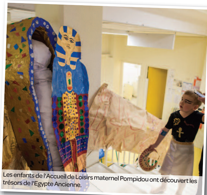
Les enfants de l'Accueil de Loisirs maternel Pompidou ont découvert les trésors de l'Egypte Ancienne.