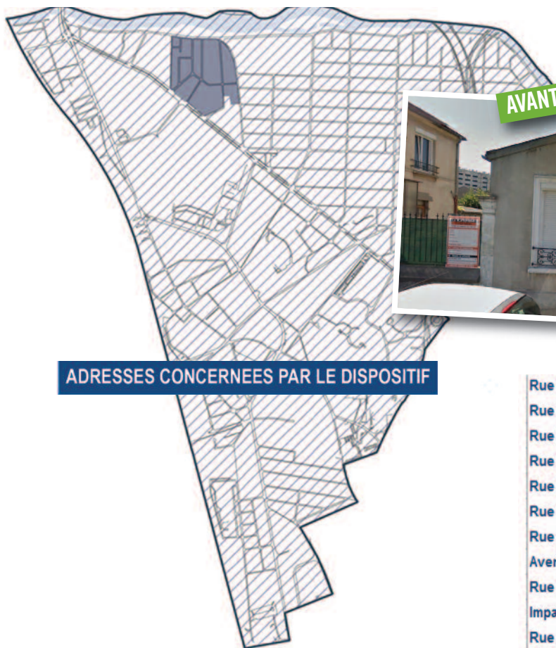
ADRESSES CONCERNÉES PAR LE DISPOSITIF

> Service Urbanisme : 5/7 rue Pierre Séward – Tél. : 01 43 96 77 68