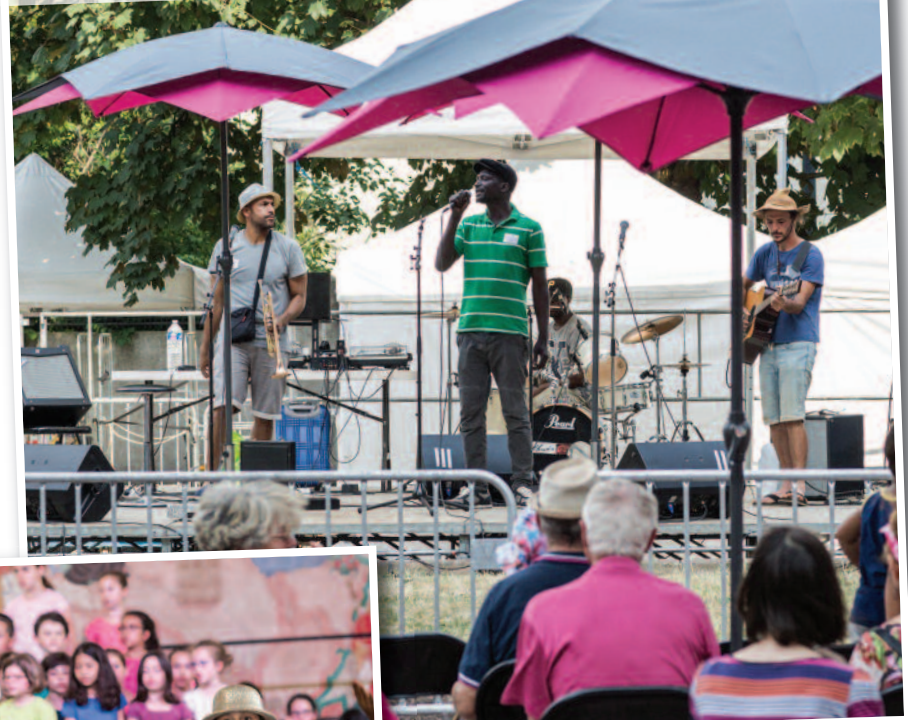
La musique était au rendez-vous dans notre ville.