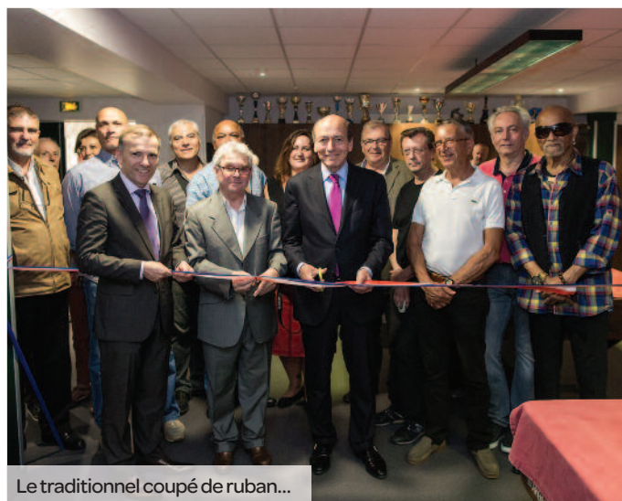
Le traditionnel coupé de ruban...

Afin d'accueillir l'association dans son nouveau local, la Ville a réalisé plusieurs travaux de décembre 2016 à mai 2017 : maçonnerie-menuiserie, électricité, plomberie, désenfumage, peinture, revêtement des sols et ventilation. La pièce centrale comprend désormais huit billards français (trois de 3,10 m et cinq de 2,80 m). Après le traditionnel coupé de ruban, les personnes présentes pour l'occasion ont pu assister à une démonstration de ce sport suivie d'un verre de l'amitié. Pour rappel, l'ABMA compte 82 adhérents dont 40 compétiteurs qui durant cette saison sont parvenus à obtenir plusieurs médailles notamment dans les compétitions du Val-de-Marne et de la Ligue de billard. Notons aussi la présence de trois représentants du club dans diverses disciplines du Championnat de France. Félicitations !