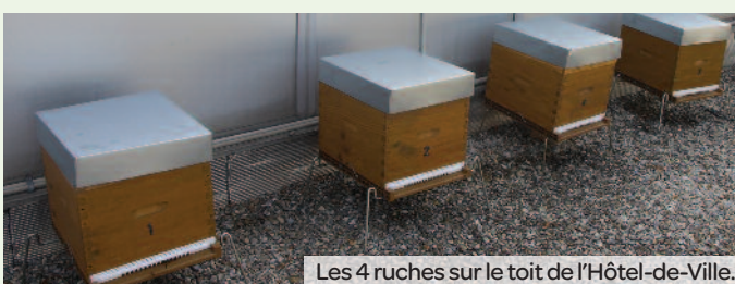
Les 4 ruches sur le toit de l'Hôtel-de-Ville.

confection de la gelée royale, nourriture exclusive de la reine. Malmenées à la campagne du fait de l'utilisation massive de pesticides et de la présence du frelon asiatique, les abeilles se réfugient ces dernières années en ville où elles trouvent un terrain plus propice à leur développement. C'est notamment le cas à Maisons-Alfort où la Ville n'utilise aucun produit phytosanitaire pour l'entretien de ses espaces verts. Elles peuvent désormais compter sur M. Duquenne et la Ville de Maisons-Alfort pour fonder de nouveaux essaims et continuer ainsi à préserver la biodiversité à Maisons-Alfort.