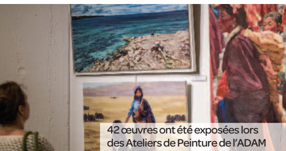
42 œuvres ont été exposées lors des Ateliers de Peinture de l'ADAM

Les Ateliers de Peinture de l'Amicale Des Artistes Maisonnais (ADAM) organisés du 8 au 24 juin derniers à la Médiathèque André Malraux ont connu un beau succès grâce aux talents des 20 artistes qui présentaient 42 œuvres. Cette année, l'invité d'honneur était M. Jian, grand artiste peintre originaire de Chine.