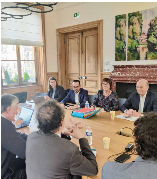
Échanges avec les équipes de la RATP et son président Jean Castex sur les dossiers qui concernent Maisons-Alfort.