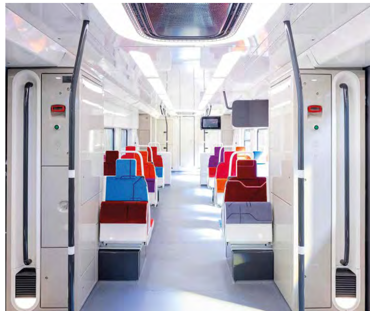
Les RER NG, plus lumineux et confortables, seront mis en circulation en 2024 sur la ligne D.