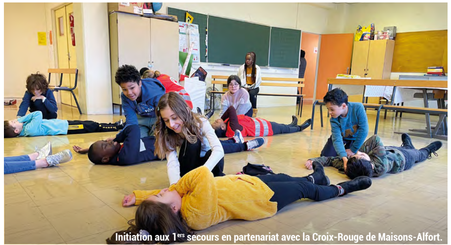
Initiation aux 1 ers secours en partenariat avec la Croix-Rouge de Maisons-Alfort.

La Ville met un point d'honneur à offrir à tous les enfants la possibilité de pratiquer régulièrement des activités physiques diverses et variées. L'occasion