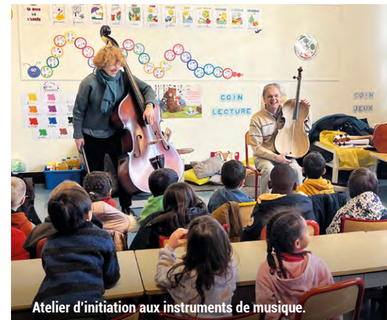
Atelier d'initiation aux instruments de musique.

Afin de permettre au plus grand nombre d'enfants un accès à l'éducation musicale et artistique, le conservatoire Henri Dutilleux se déplace dans les classes : sur l'année 2023/2024, ce sont ainsi près de 1400 élèves qui ont participé aux ateliers de découverte instrumentale et 105 qui ont bénéficié du programme d'initiation à la danse, un projet en 10 séances et qui se clôture en beauté, par une restitution.