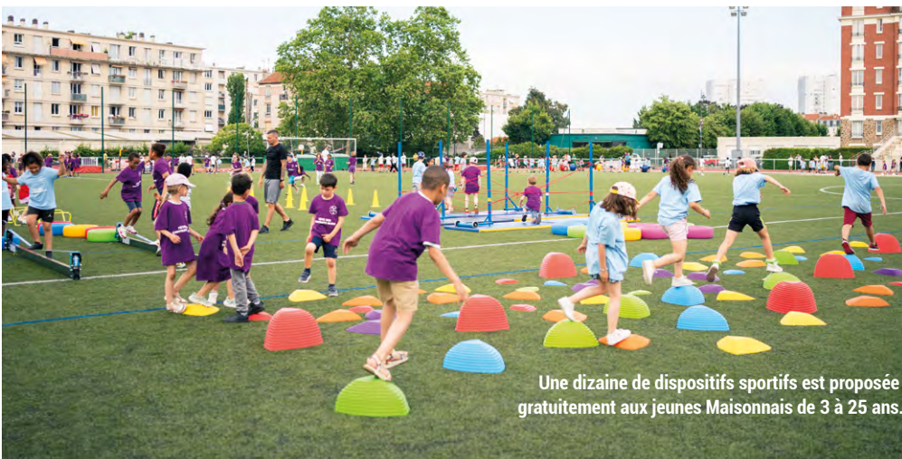
Une dizaine de dispositifs sportifs est proposée gratuitement aux jeunes Maisonnais de 3 à 25 ans.

Retrouvez l'ensemble de ces informations à tout moment dans l'année grâce au guide de rentrée. Mis à jour chaque année, il est disponible sur le site Internet de la Ville, rubrique « Famille et éducation » ou en version papier à la mairie, à la Direction Enfance-Éducation.