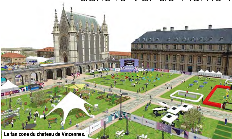
La fan zone du château de Vincennes.

Deux fan zones accessibles gratuitement seront installées tout au long de la durée des Jeux Olympiques :