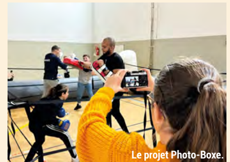
Le projet Photo-Boxe.

De leurs côtés, les médiathèques de la Ville ont travaillé sur divers projets de médiation culturelle à destination des écoles et du public maisonnais qui ont obtenu le label « Olympiades culturelles » décerné par le Comité olympique. À l'image du projet Photo-Boxe monté en partenariat avec l'Institut national d'histoire de l'art à destination d'enfants qui fréquentent les maisons de quartier ou encore de celui réalisé avec deux