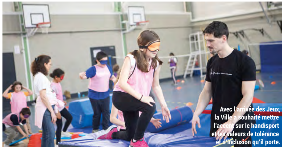
Avec l'arrivée des Jeux, la Ville a souhaité mettre l'accent sur le handisport et les valeurs de tolérance et d'inclusion qu'il porte.

Ces trois dernières années, la Ville de Maisons-Alfort s'est engagée dans des actions nationales comme la Semaine Olympique et Paralympique dans les écoles tout en poursuivant son action à l'échelle locale en faveur d'une pratique sportive pour tous. Lors de chaque édition de la Semaine olympique et paralympique, ce sont ainsi près de 1600 Maisonnais des écoles élémentaires qui bénéficient d'ateliers découverte. Avec l'arrivée des Jeux, la Ville a souhaité