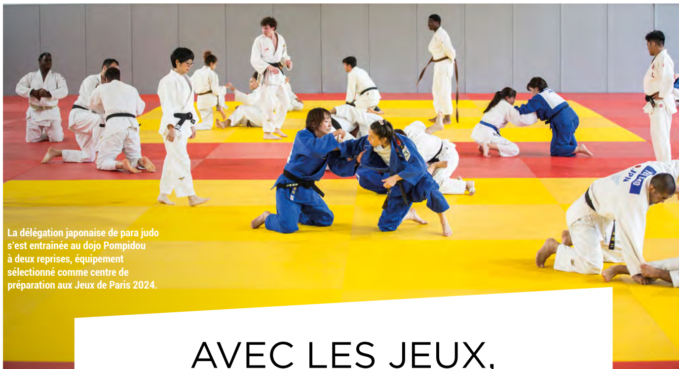
La délégation japonaise de para judo s'est entraînée au dojo Pompidou à deux reprises, équipement sélectionné comme centre de préparation aux Jeux de Paris 2024.