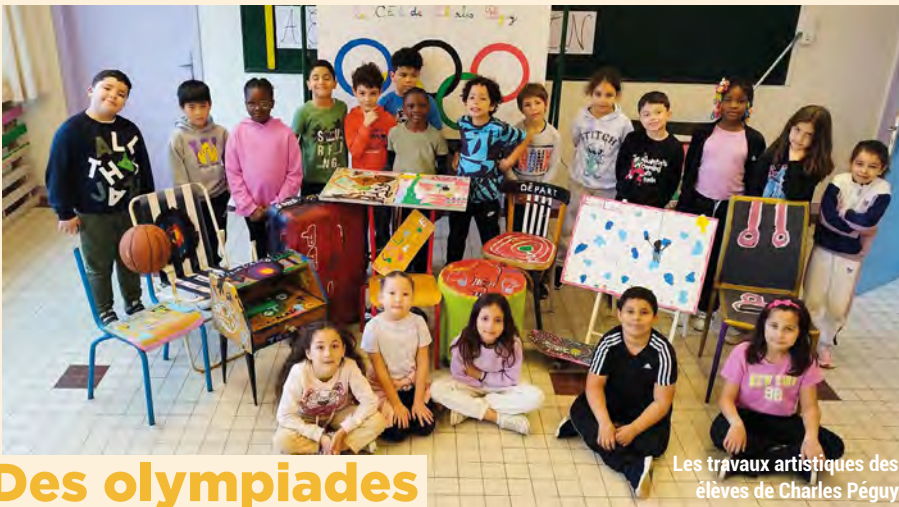
Les travaux artistiques des élèves de Charles Péguy.

de France Junior et Senior de judo et entraîneur du Pôle Espoirs de l'Île-de-France, sont venus à la rencontre des écoliers maisonnais lors de l'édition 2022.