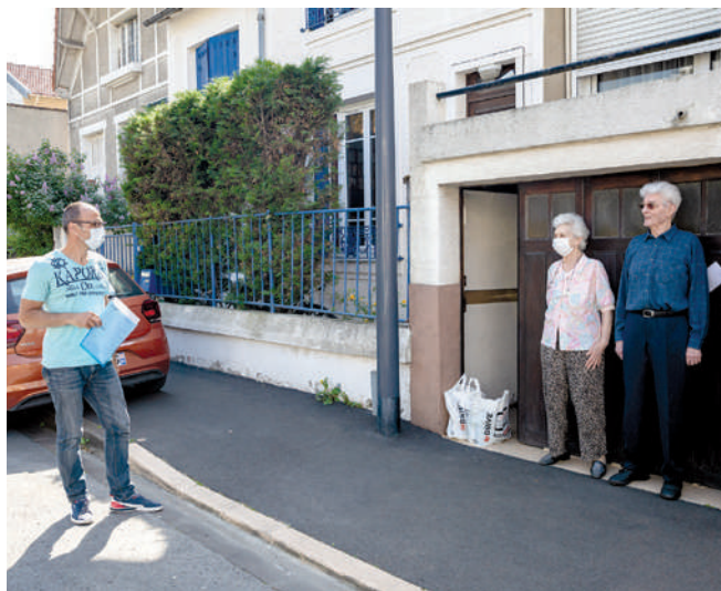
La livraison de courses et médicaments a bénéficié à plus de 100 Maisonnais durant le confinement.

pathologie particulière, de même, qu'un dispositif de chèques alimentaires pour les familles vulnérables, qui sont les plus touchées par la crise sanitaire. Dans la continuité de ces actions, la Ville a décidé d'augmenter en cette fin d'année, via le CCAS, les subventions allouées aux associations solidaires particulièrement sollicitées cette année, à l'image des Restos du Cœur, du Rotary Club, ou encore du Lions Club.