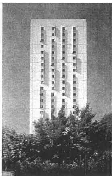
Paris 14 ème – Tour Renoir (réhabilitation)